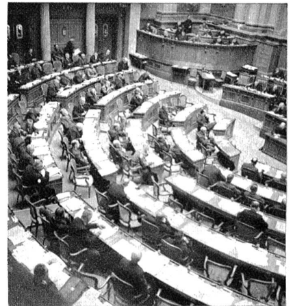
Rechts: Ausschnitt aus dem Nationalratssaal mit Blick auf die östliche Journalistentribüne.