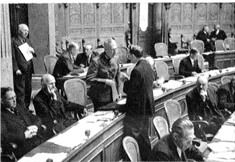
Links: Nationalrat Dollfuss vor seinem Pult im Gespräch mit Bundesrat Pilet-Golaz.