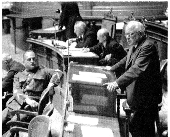
Bundespräsident Etter steht am Donnerstagmorgen im Namen des Bundesrates Rede und Antwort auf die Anfragen und Anregungen, die am Vortage durch die sieben Fraktionsredner vorgebracht worden sind.