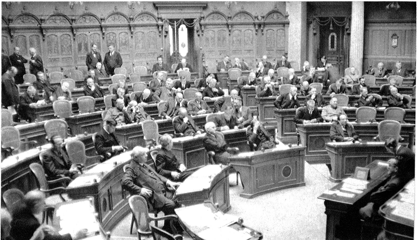
Der Nationalratssaal während der Rede von Nationalrat Hoppeler. Unser Bild wurde von der Journalistentribüne Ost aus aufgenommen, mit Blickrichtung gegen das Bundesratszimmer.