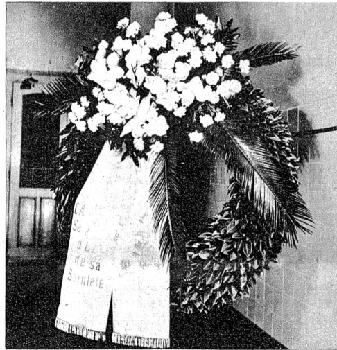
Kranz des Heiligen Stuhls.