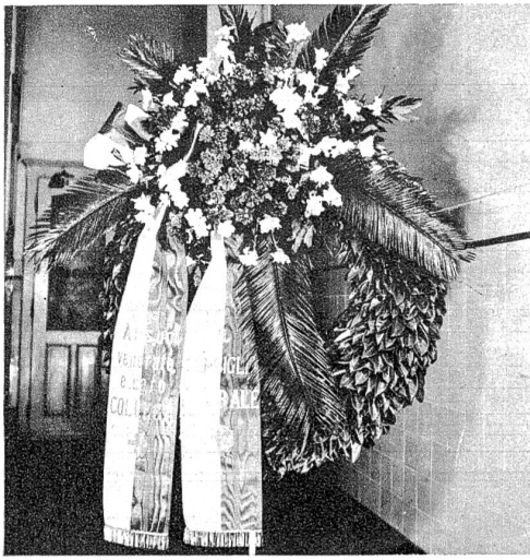
Der schweizerische Bundesrat seinem verehrten lieben Kollegen.