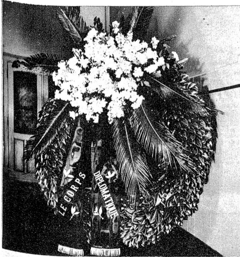
Kranz des Diplomatischen Corps.