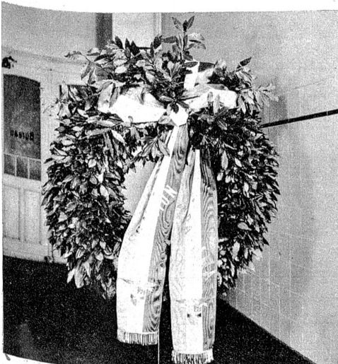
Kranz der Legation von Panama.

Blumenspenden am Grabe eines Toten sind eine der schönsten und sinnvollsten Ehrungen, die man einem Verstorbenen als letzten Gruss erweisen kann. Es ist der Ausdruck des Dankes für ein Leben, das damit mit wehmützlichem festlichen Glanz von uns scheidet. Wie den Trauerblumen bestimmt ist zu verwelken, so sind sie gleichsam ein Symbol der Vergänglichkeit eines Menschenlebens. Blumenspenden sind die letzten Gaben, die letzten Liebes- und Dankesbezeugungen, die wir einem Menschen ins Grab mitgeben, ein Opfer, für den nüchternen Alltagsverstand wohl unnützlich und sinnlos, aber wie jedes Opfer eine Tat, die weit über allem klugen Berechnen und Ueberlegen steht. Denn Dank und Liebe fragen nicht nach Zweck und Nützlichkeit.