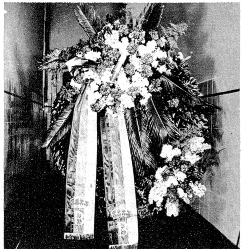
Kranz des Königs Boris von Rumänien.

Blumenspenden am Grabe eines Toten sind eine der schönsten und sinnvollsten Ehrungen, die man einem Verstorbenen als letzten Gruss erweisen kann. Es ist der Ausdruck des Dankes für ein Leben, das damit mit wehmützlichem festlichen Glanz von uns scheidet. Wie den Trauerblumen bestimmt ist zu verwelken, so sind sie gleichsam ein Symbol der Vergänglichkeit eines Menschenlebens. Blumenspenden sind die letzten Gaben, die letzten Liebes- und Dankesbezeugungen, die wir einem Menschen ins Grab mitgeben, ein Opfer, für den nüchternen Alltagsverstand wohl unnützlich und sinnlos, aber wie jedes Opfer eine Tat, die weit über allem klugen Berechnen und Ueberlegen steht. Denn Dank und Liebe fragen nicht nach Zweck und Nützlichkeit.