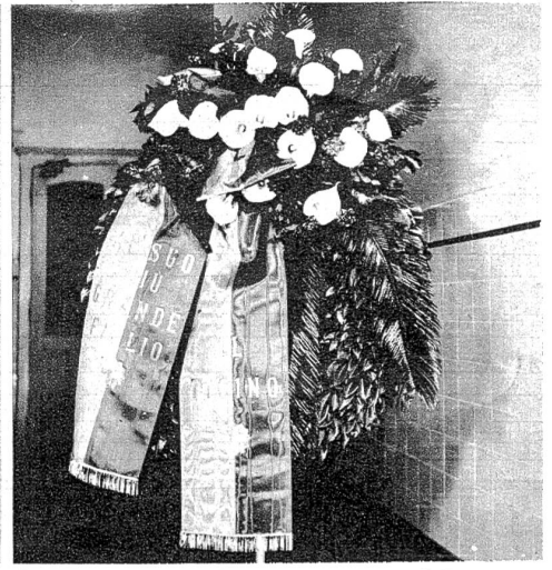
Der Tessin seinem grössten Sohn.