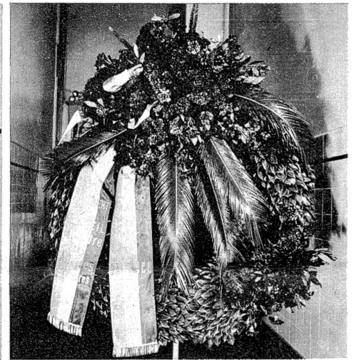
Kranz des französischen Ministerpräsidenten Daladier.