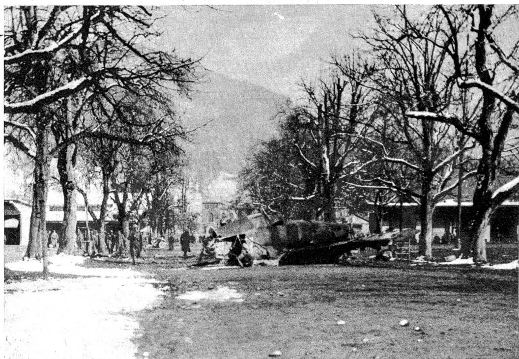
Ein Jagdflugzeug stürzt bei der Landung auf der Thuner Allmend infolge Geschwindigkeitsverlustes auf den Übungsplatz einer Artillerierekrutenschule ab. Eine Gruppe am Geschütz über der Rekruten wurde getroffen. Vier Mann wurden auf der Stelle getötet und der Fünfte starb nach der Einlieferung ins Krankenhaus. — Wir zeigen eine Aufnahme der Unfallstelle mitten in einer Baumallee. Die Maschinentrümmern des abgestürzten Jagdflugzeuges sind erkennbar. (Zensur-Nr. VI B 1176 Photopress)