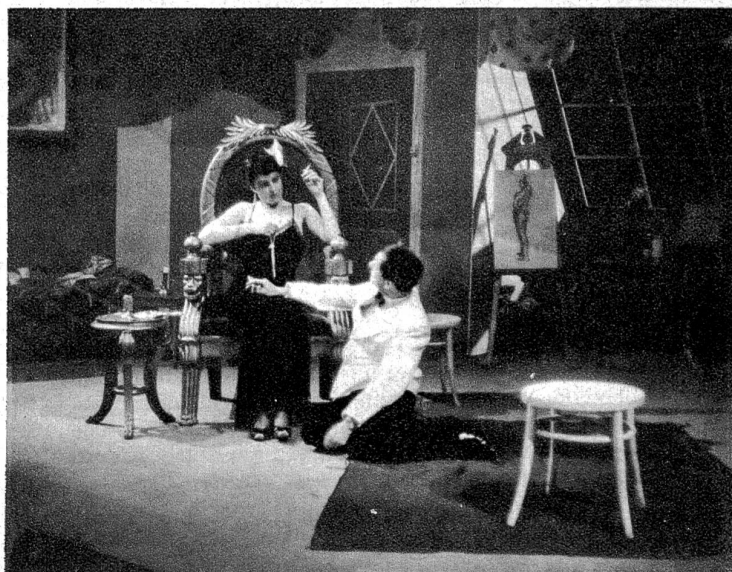
In ihrer Gefühlsverwirrung ist Ninon ins Atelier des Kunstmalers Lenchen (Alfred Lohner) geraten, der ihr statt einer Liebeswerbung seine Geldnöte vorträgt.