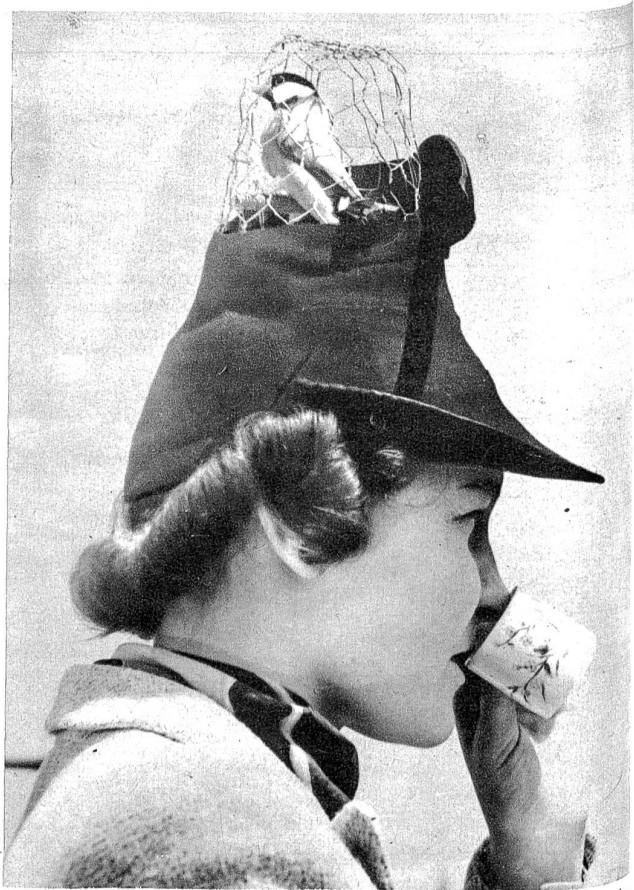
Junge Dame mit einem richtigen Vogel — auf dem Hut! Sensationelle Modeschöpfung aus New York, wo man um alles auffallen will. Die Photo wurde im Schweizer Pavillon an der New Yorker Weltausstellung aufgenommen; das heisst natürlich noch lange nicht, dass „Sie“ eine Schweizerin ist. Hoffentlich nicht.