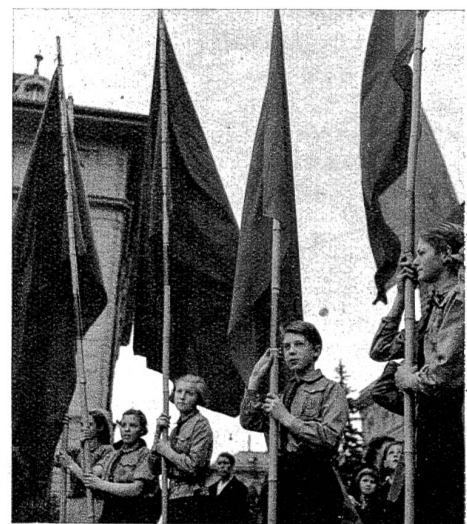
Die Sturmflaggen der Roten Falken.