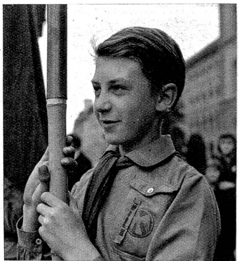
Sie und Er von den Roten Falken.