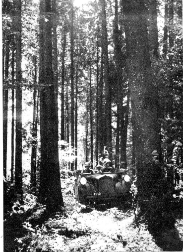
Die Motorradfahrer-Kundschafter. Z.-Nr. N.T. 563.