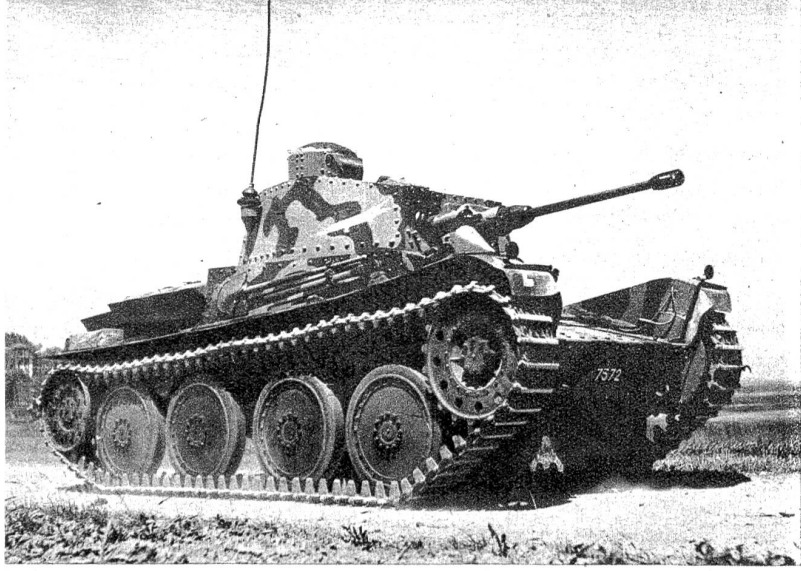
Ein Tank in voller Fahrt. (Zensur Nr. N T 561)