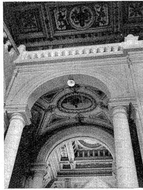
Der Ausgang zum grossen Saal