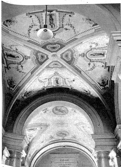
Die Decke über dem Eingang