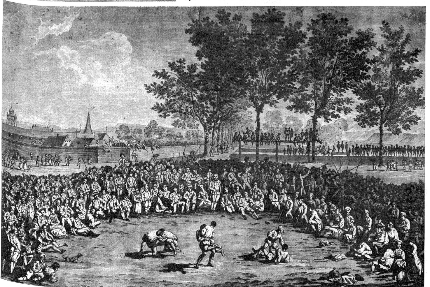
Ostermontagschwingfest auf der Kleinen Schanze in Bern (um 1810), jenes Schwingfest, von dem Gotthelf einmal berichtete: „Am Ostermontag läuft, wer noch laufen mag, vor das obere Tor, dem Schwinget zuzusehen. Dort schwingen die Oberländer und Emmenthaler gegen einander und eifern um den höchsten Preis: . . . Wo die Landeskraft am grössten sei, darum wird gerungen, und es ist wirklich schön, mit welchem Ernste und in bestimmten Formen der feste Emmenthaler und der flinke Oberländer um die Ehre ringen“.

Unser Nationalturnen: im Vordergrund übt einer Weitsprung ohne Anlauf, hinter ihm ist einer am Steinstossen, zwei weitere sind wohl Schnell-Läufer, nach den fliegenden Haaren zu schliessen, die aber merkwürdigerweise Arm in Arm laufen, und ganz im Hintergrund, hinter den drei Zuschauern, zwei Schwinger. Diese Zeichnung, eine Illustration in der Luzerner Bilderchronik des Diebold Schilling, die im Jahre 1513 niedergeschrieben wurde, ist die älteste Darstellung des Schwingens, wie auch unserer übrigen nationalen, volkstümlichen Sportarten. — „Will üsi Alte brav heigschwunge, so isch's nen ou bim Chrieger glunge“, heisst ein altes berndeutsches Sprichwort.