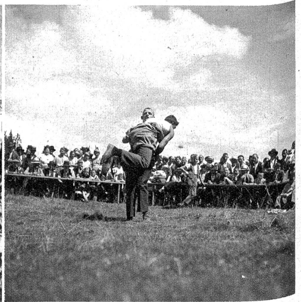
Bergschwinget auf der Grossen Scheidegg — einst . . . . . und Lüderenalp-Chilbi — jetzt.