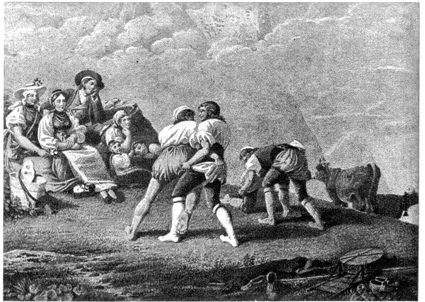
Aelperschwinget, nach einem Original von G. Lory Sohn (1784—1846).