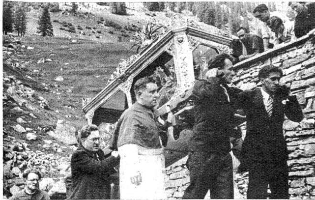
Der Heilige Theodor: ein römischer Märtyrer aus den Katakomben in Rom. Der mit Gold und edlen Steinen reich geschmückte Sarg des Heiligen wurde im Jahre 1938 anlässlich des 250. Jahrestages seiner Ueberführung in die Kirche von Bosco, in der feierlichen Prozession mitgetragen.