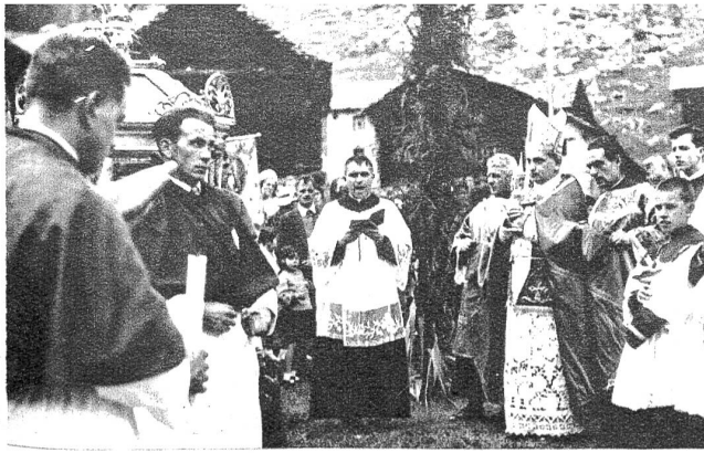
Bilder von einer hochfeierlichen Prozession in Bosco.