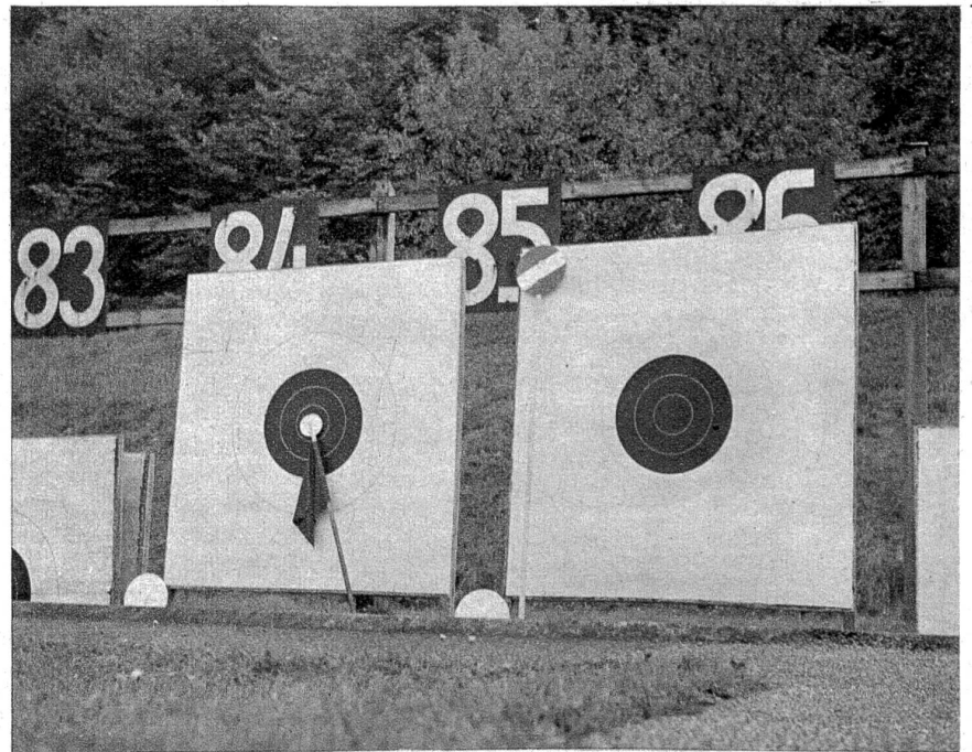
Glück und Unglück trag in Ruh! Das sind zwei böse Nachbarn: Ein Fünfer und ein Nuller hoch links oben; so will es das Geschick. Im Scheibenstand ist man stark mit Kleistern und Zeigen beschäftigt und ein kleines Pflästerchen klebt die böse Wunde zu.