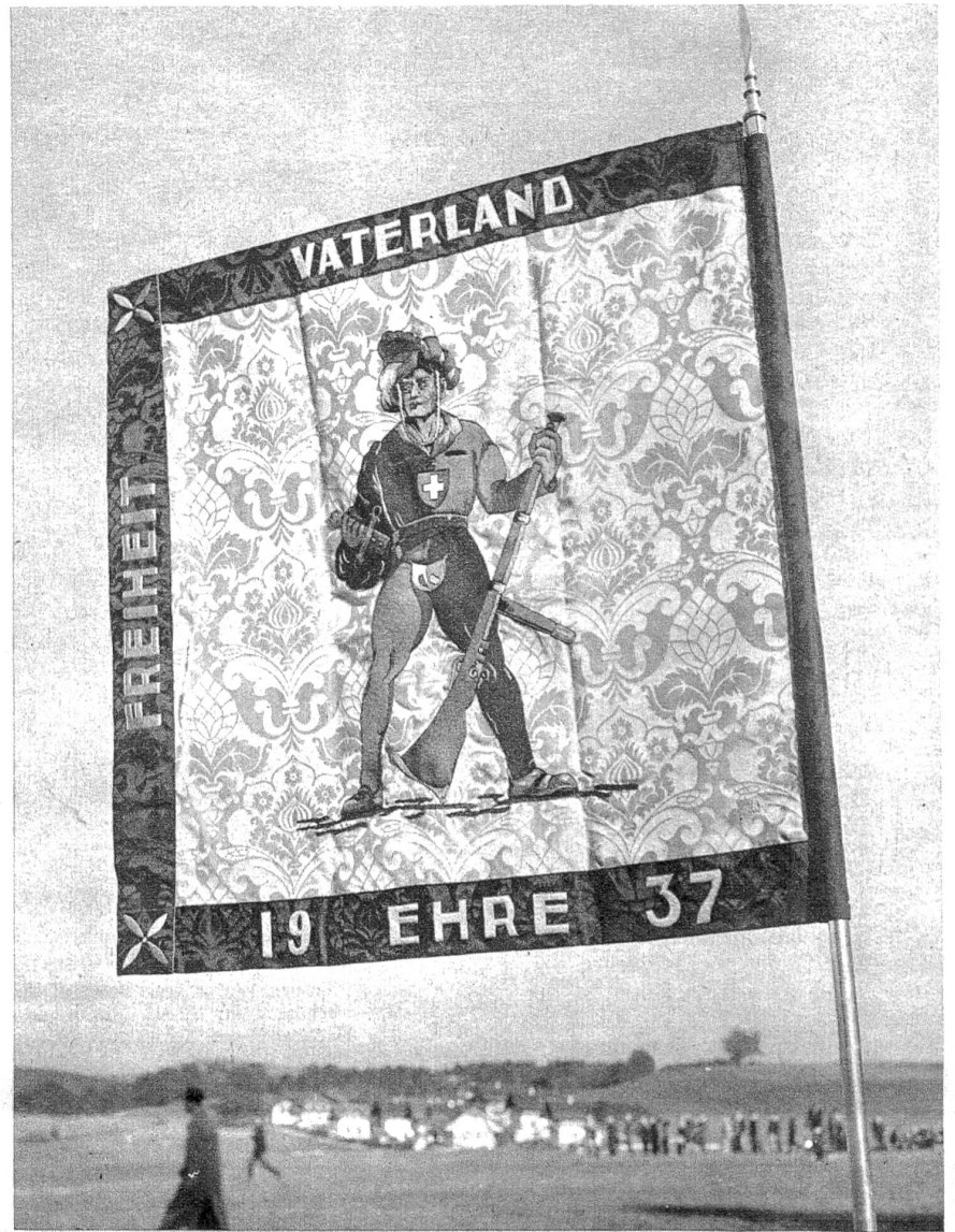
Die schicke Jungschützen-Wanderstandarte , gestiftet vom Mittelländischen Schützenverband, war das lohnende Ziel des Gruppenwettkampfes.