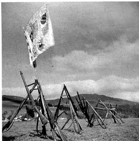
Das Fähnlein der Siegergruppe flattert erwartungsvoll im Herbstwind.