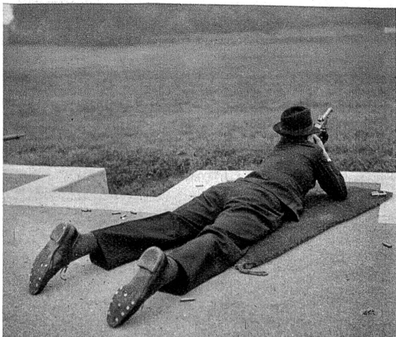
Es ist ein langer Weg, von der Schuhsohle über Visier und Korn zur Scheibe.