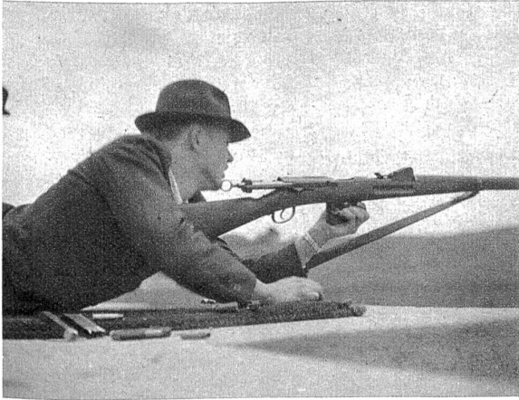
Mit Spannung erwartet der Schütze das Auftauchen der Zeigerkelle.