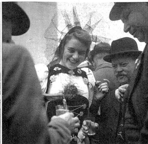
Von zarter Hand und aus fröhlichem Herzen überreicht schmeckt ein Willkommtrunk doppelt gut!