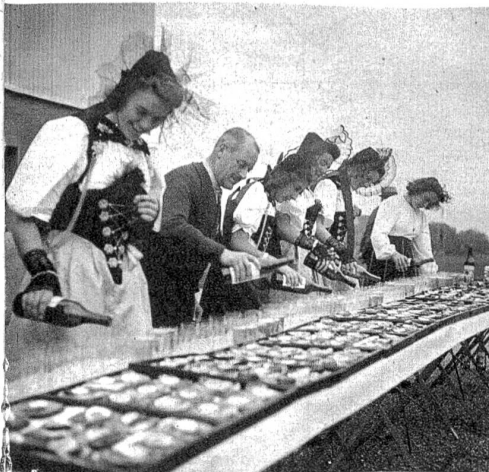
Auf dem neuen Sportplatz, auf welchem das abgesagte Eidg. Turnfest 1940 hätte stattfinden sollen, kredenzt die Stadt Bern den Gästen einen Willkommtrunk.