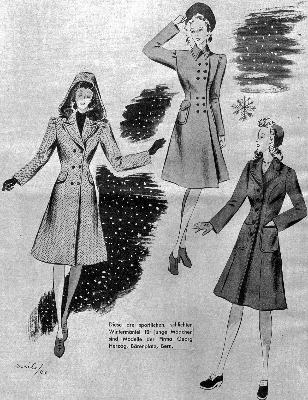
Diese drei sportlichen, schlichten Wintermäntel für junge Mädchen sind Modelle der Firma Georg Herzog, Bärenplatz, Bern.