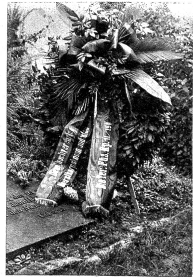
Soldaten legten am Grabe ihres einstigen Kommandanten einen Kranz nieder