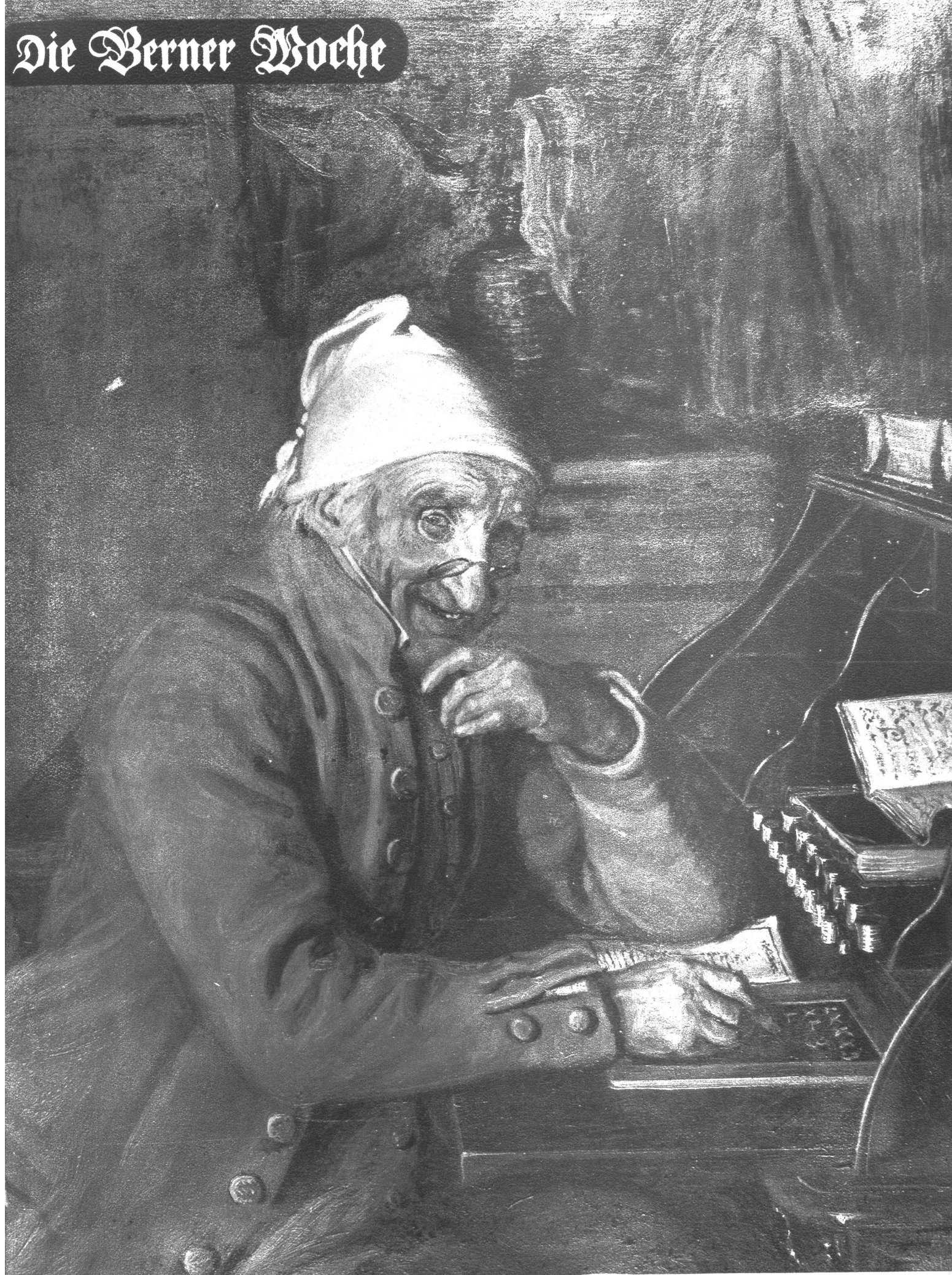
Hansjoggeli, der Erbvetter eine jedem Berner aus Jeremias Gotthelfs Geschichte der Simon Gfellers Theaterstück wohlbekannte Figur. Oelgemälde v. Fr. Walthard (1818—1870).