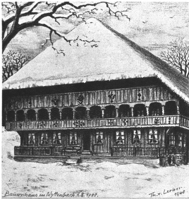
Bauernhaus in Wytttenbach i. E. 1788.