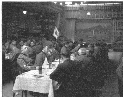
Blick in den Festsaal.