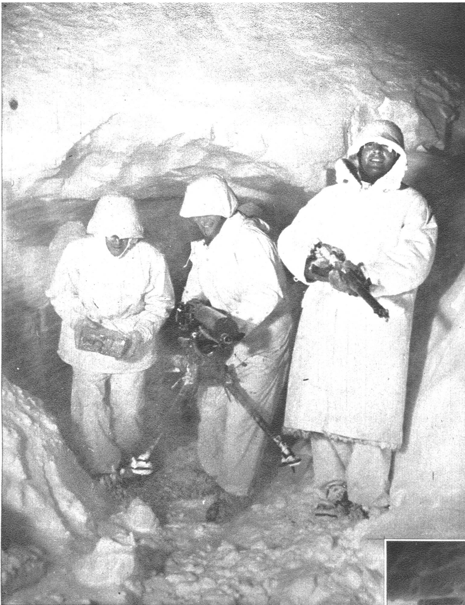
In der soeben gebauten Eiskaverne ist die Mg.-Stellung bezogen worden. In Feuerbereitschaft wartet die Mannschaft mit Spannung auf ihren Einsatz.