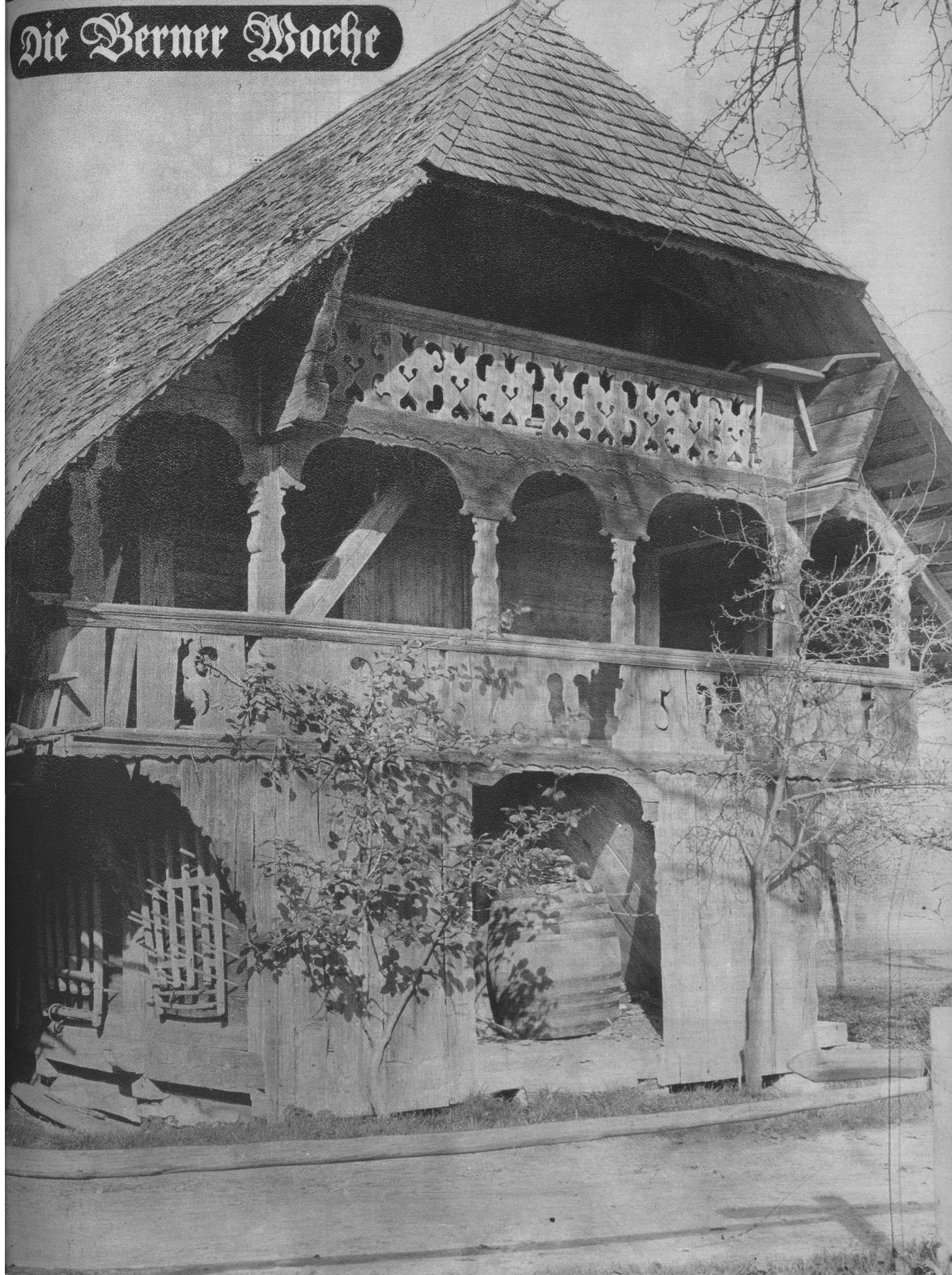
Speicher in Dürrenroth mit charakteristischen Laubenausschnitten. (Zum Bildbericht „Die schönen Speicher im Untermmental und Oberaargau“ von Albert Stumpf)