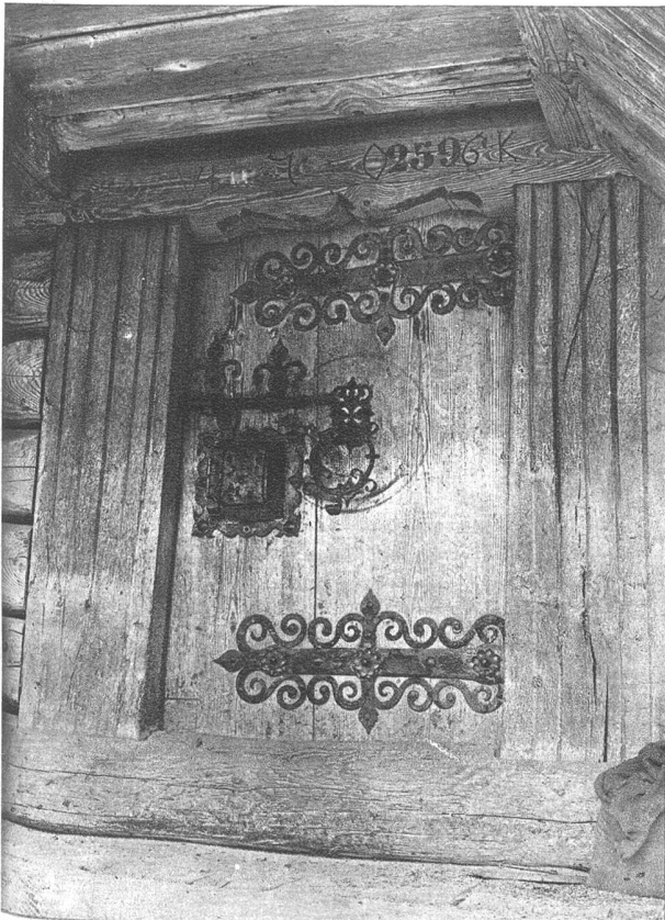
Reich verzierte Beschläge und prachtvolles Schloss an einem Speicher bei Huttwil geben einen Begriff von der Hablichkeit des Erbauers im Jahre 1706, zeigen aber ebenso sehr die hohe Kunstfertigkeit des Schmiedehandwerks jener Zeit.