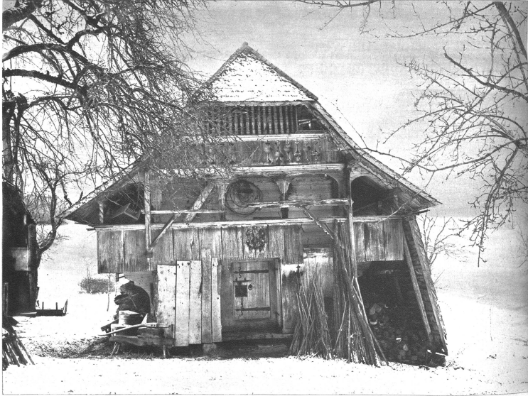
Ein Speicher in Wyssbach bei Madiswil aus dem Jahre 1712. Eine Besonderheit bildet hier die abgeschlossene obere Laube mit den schönen gedrehten Pfosten, das schöne Schloss und die Beschläge an der unteren Türe sowie die wappenartige Verzierung über dem Eingang.