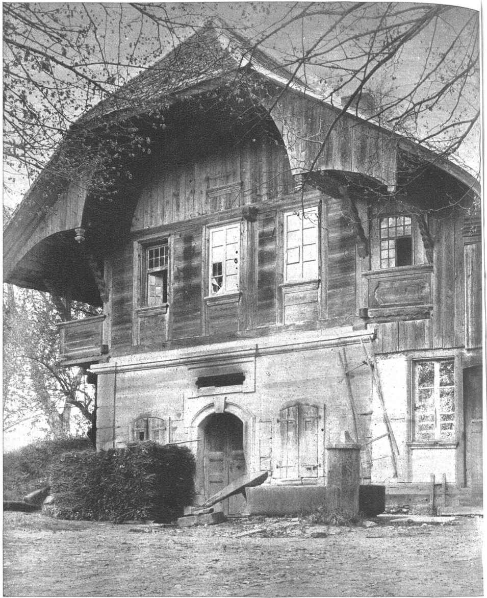
Käserhaus bei Kleindietwil, ehemals eine Käserei, jetzt Stöckli.