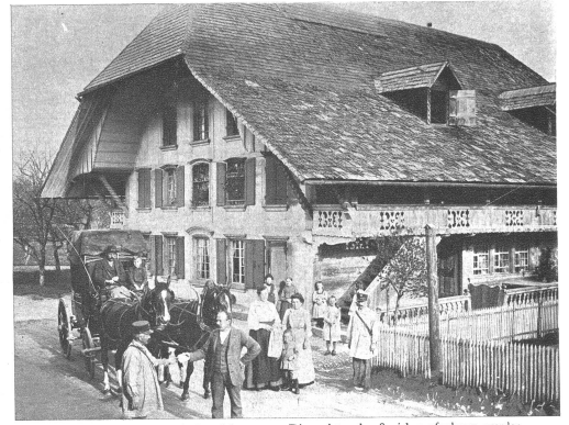
Die letzte Post in Dürrenroth im Jahre 1913. Die meisten der Speicheraufnahmen wurden vor 30 und mehr Jahren gemacht. Vieles hat sich seither verändert.