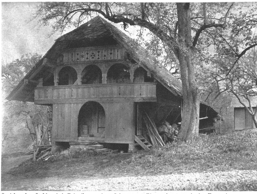
Speicher im Stalden bei Eriswil aus dem Jahre 1754. Eine gedrungene, breite Form des Speicherbaues, wie sie in dieser Gegend üblich ist. Man beachte die harmonische Aufteilung der Fläche durch die wohlproportionierten Laubenbogen und den Bogen über dem untern Eingang.