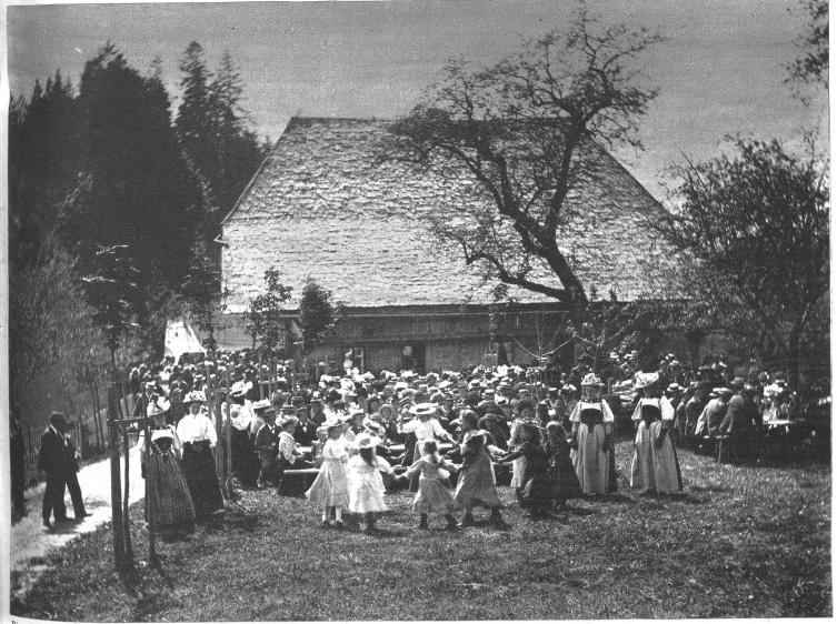
Eine Dorfchilbi in Oberwald ob Dürrenroth vor 30 Jahren.