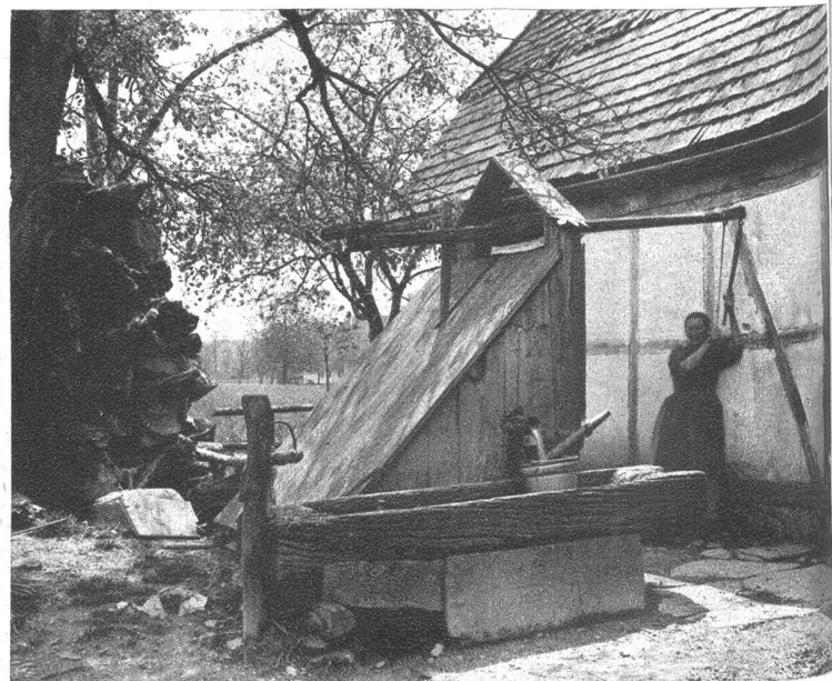
Der letzte Sodbrunnen in Bannwil vor der Einrichtung der allgemeinen Wasser- versorgung durch die Gemeinde im Jahre 1913.