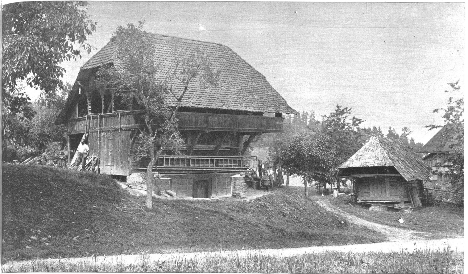
Zwei Speicher in Rütshelen aus dem 18. Jahrhundert. Der eine gross und reich, mit steinernem Unterbau, der andere schlicht und einfach, die gewöhnliche Konstruktion aus Rundholzstämmen deutlich erkennen lassend.