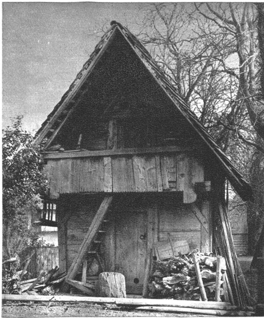
Speicher in Oberbipp aus dem Jahre 1742. Solothurner Typ.