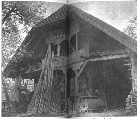
Speicher in Bannwil aus dem Jahre 1861, mit der Remise und Wagenschopf ausgebaut. In dieser Art ein seltener Typus in der Gegend.