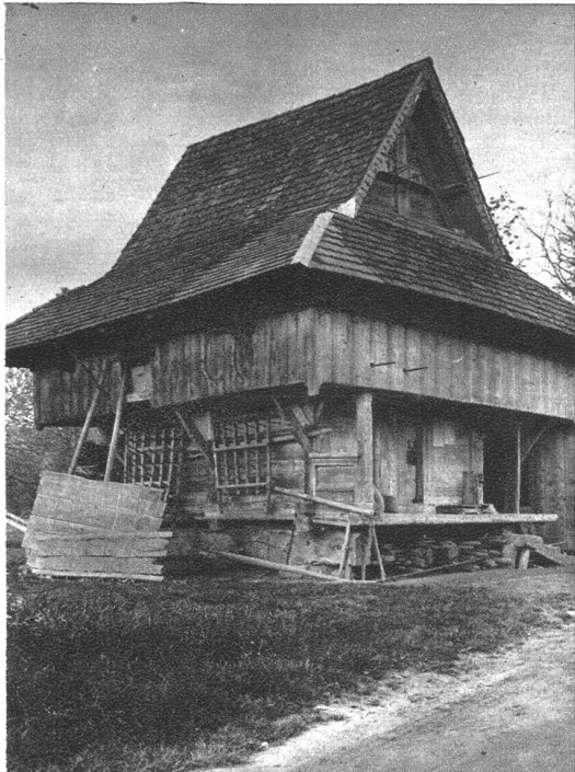
Einer der ältesten Speicher, aus dem Jahre 1687, in Meiswil. Aargauertyp.