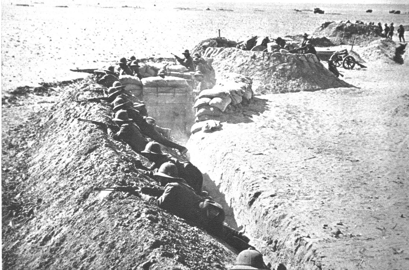
Wawells libysche Armee wieder stossbereit: Italienisch-deutsche Verteidigungslinien in der Syrtenwüste. Trotzdem die britischen Mittelmeer- und Ostafrika-Armeen gegenwärtig genügend Fronten zu decken haben, an denen grosse Aktionen bereits laufen oder nächstens zu erwarten sind, will sich General Wawell wohl die Initiative in der Cyrenaika nicht wegnehmen lassen. Australische Tankformationen sind soeben tief in die östliche Partie der Syrtenwüste vorgedrungen, ohne auf Widerstand zu stossen. Dass aber die Italiener und die Deutschen fieberhaft an einem Verteidigungssystem arbeiten, beweist dieses Bild, das in der Syrtenwüste aufgenommen wurde. Ein tief gestaffeltes System von Feldbefestigungen und Werken soll den erwarteten Stoss von Wawells Armee gegen Tripolitaniens aufhalten. Da die Aktionen nicht nur langs der Wüstenstrasse erwartet werden, so erstrecken sich diese Verteidigungsmassnahmen auch weit ins Innere der Wüste.