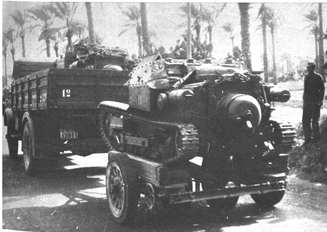
Italien.-deutsche Verteidigungs-Organisation in Tripolitaniens: Erste Aufnahmen des deutschen Afrika-Korps. Nach den letzten Meldungen scheinen Italien und Deutschland die Verteidigung Tripolitaniens mit allen Mitteln zu organisieren, um dem erwarteten Wawell'schen Vorstoss über die Cyrenaika hinaus erfolgreich zu begegnen. Soweit es die britische Kontrolle der Verbindungen nach Libyen zulässt, werden grosse Material- und Truppen-Nachschübe vorgenommen, vor allem motorisierte Formationen. Unser Bild zeigt den Transport von Wüstentanks per Achse in die Verteidigungsstellungen am Westrande der Syrtenwüste, wo vorgeschobene Panzerposten bereits schon in Fühlung mit englischen Panzerpatrouillen geraten sind.