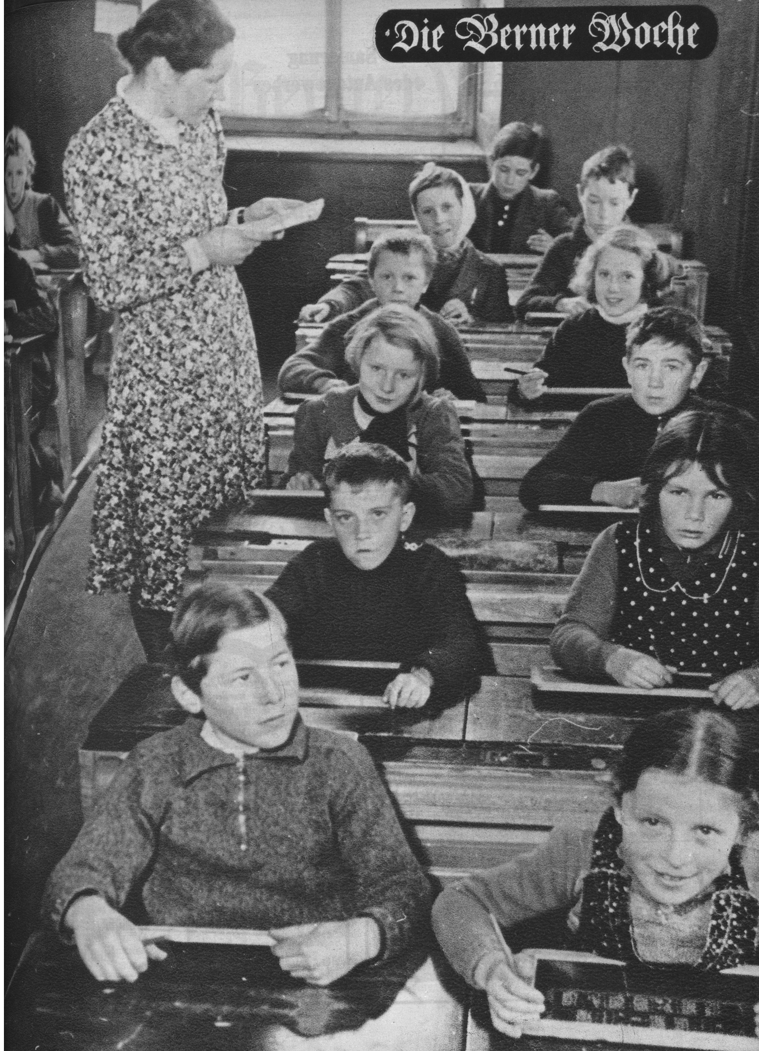
Am ersten Schultag beginnen auch die ersten Sorgen.