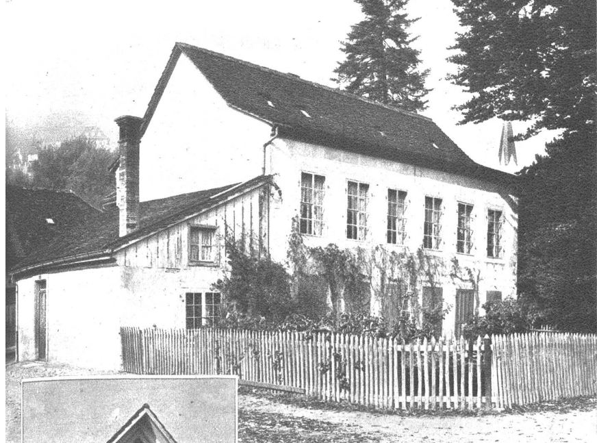
Die erste Werkstätte in Biel