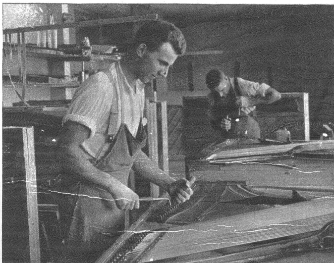
Einbau der Saiten.