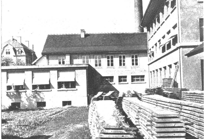
Die moderne Fabrikanlage mit allen notwendigen maschinellen Einrichtungen fortgeschrittener Produktionstechnik.

900 Instrumente entstehen jährlich in der Fabrik und seit der Gründung verließen 28,600 Klaviere die Werkstätte als Zeugen bodenständiger Arbeit.