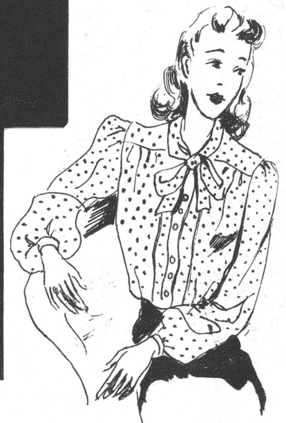
Modell Parpan, Bern.