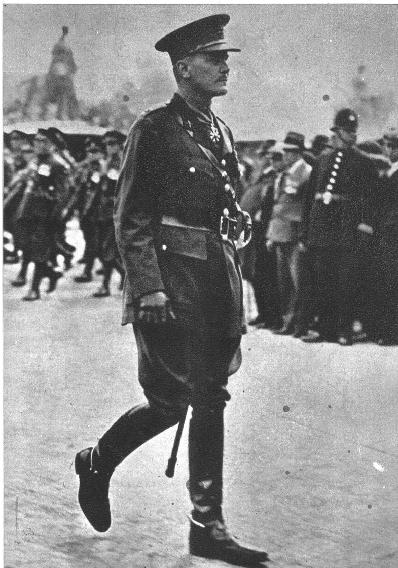
Der Verteidiger von Kreta: Generalmajor Bernard Freyberg.