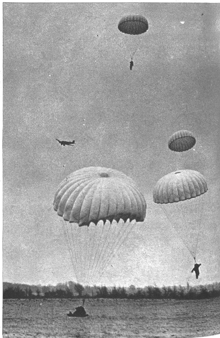
Deutsche Fallschirmschützen sind die eigentlichen Träger des Angriffes auf Kreta.