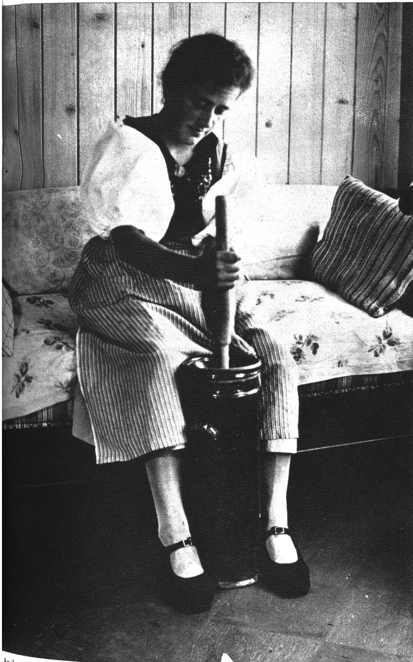
Auch s'Vreneli ist tüchtig am Werk und vor allem sauber und nett.