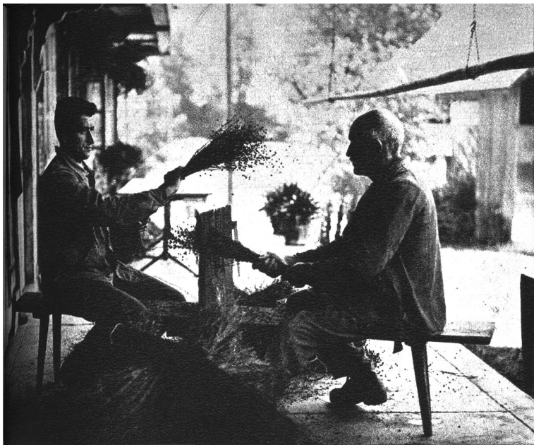
Das Flachskämmen muss verstanden sein, es sieht sich wie ein Kinderspiel an, ist aber in Wirklichkeit eine schwere Tagesarbeit.