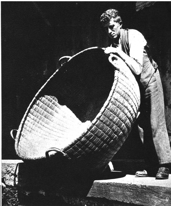
Wenn man schon den Brotkorb in diesen schweren Zeiten höher hängen soll, so macht man ihn einfach grösser und das gleicht aus . . .