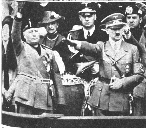
Was die Achsenmächte vereinbart hatten bei der Zusammenkunft Hitler-Mussolini, ist Tatsache geworden.