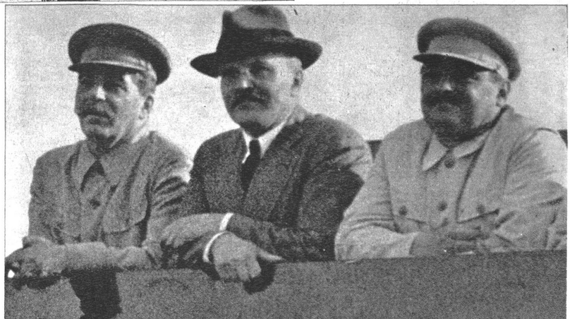
Stalin, Molotov und Zhdanov waren bis jetzt Zuschauer im europäischen Ringen, heute sind sie passiv legitimiert zum Konflikt.