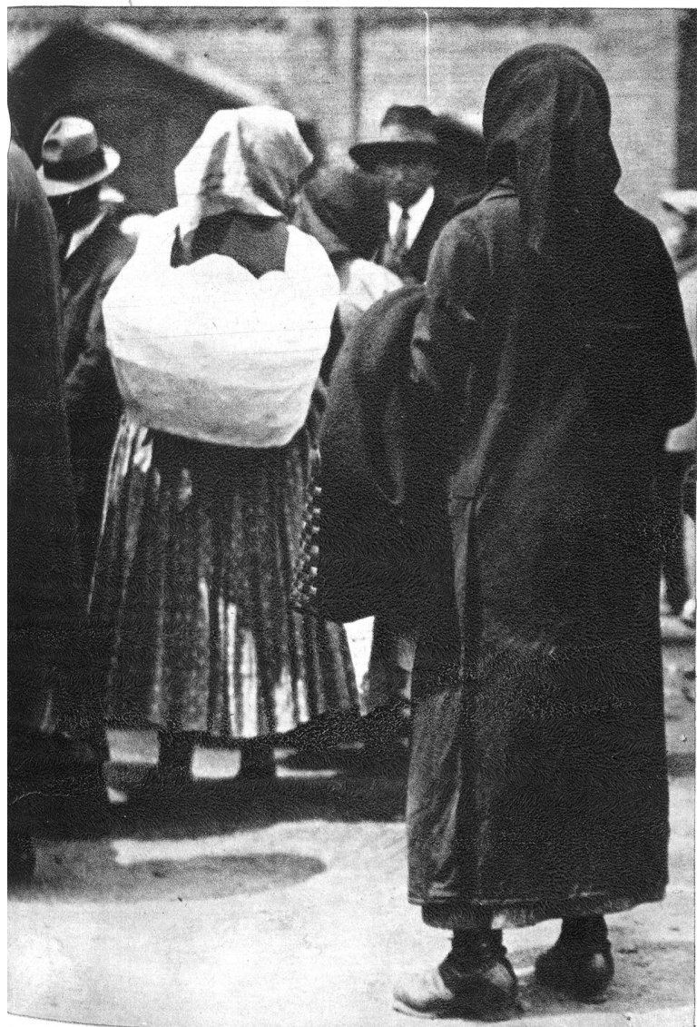
uernfamilien in den Grenzgebieten haben das Schicksal am härtesten zu er- agen.