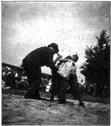
Stattlicher Nachwuchs. Die Jungen werden heute immer mehr zum alten Zweikampf nachgezogen und so finden auf freien Wiesen jeweilen an Sonntagen im Schweizerlande herum Jungschwingertage statt. Der Stärkste erhält meistens ein Schaf, vielen andern winken stattliche Preise.