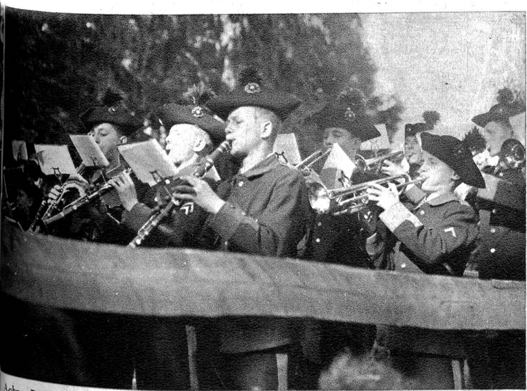
Achzig Buebe vo der Knabenmusik Bärn hei dene Hammegeglüt bis i d'Nacht die blase, piffe u trummet.