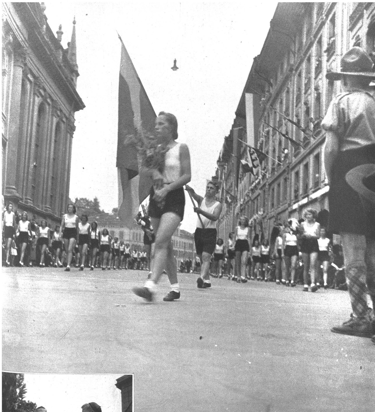
Die sportgestählte Jugend ist Träger des Festes.