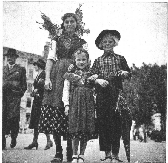
Frohe Kameraden finden sich immer zu einem Schirm, auch dann, wenn es nicht regnet.