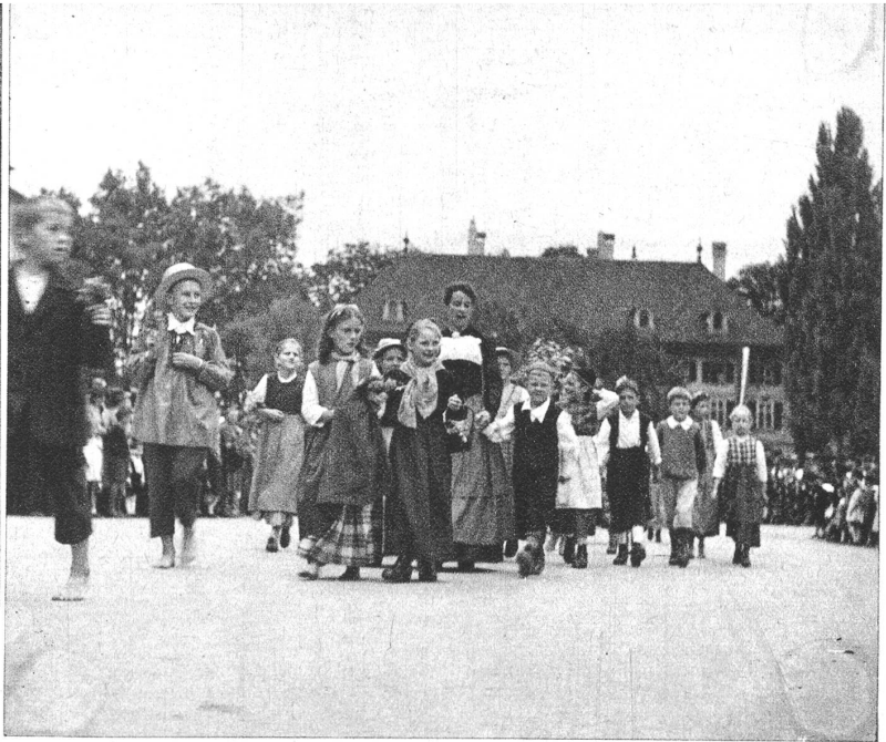
Die Gruppe nach einem Bild Ankers wirkte ausserordent- lich gut und durch die anschauliche Gestaltung war sie mehr als ein Bild im Umzug.