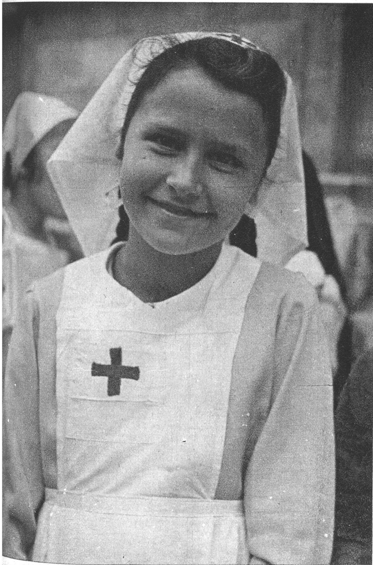
...ng und doch schon mit ernstn Gedanken beschäftigt ... Das rote Kreuz im ...n Feld.