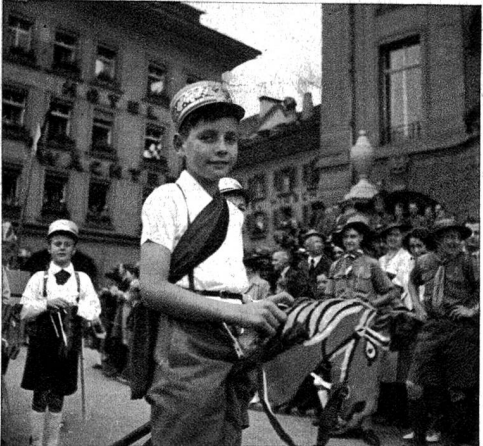
Der General im Hoppe hoppe Reiter durfte nicht fehlen.