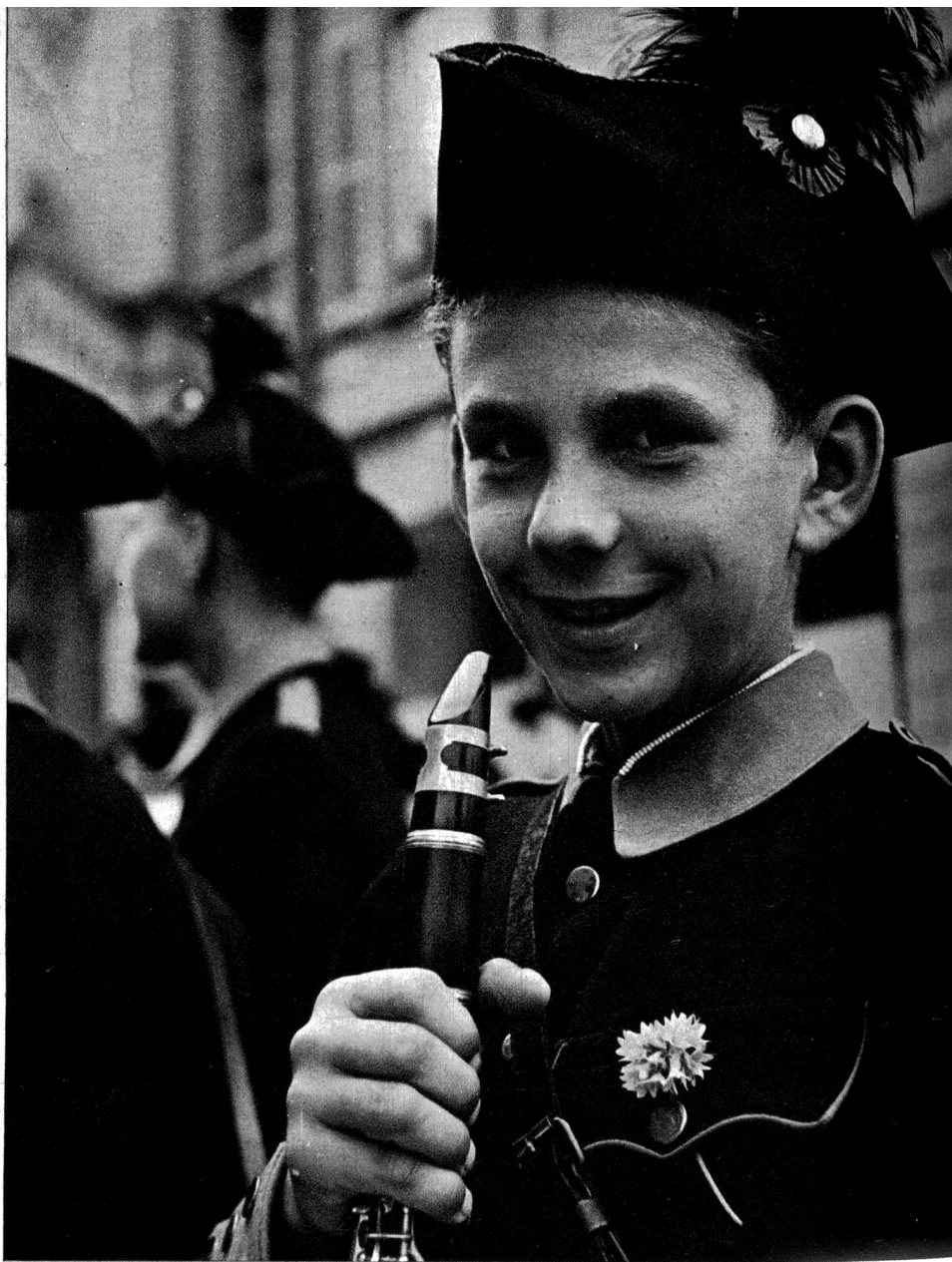
Die Musik der Jugend erfreute manches Herz und schuf aufrichtige Begeisterung.