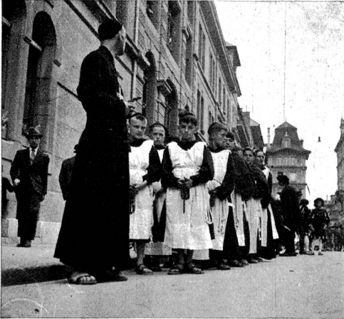
Die Gruppe der Klosterschule fand starke Beachtung.