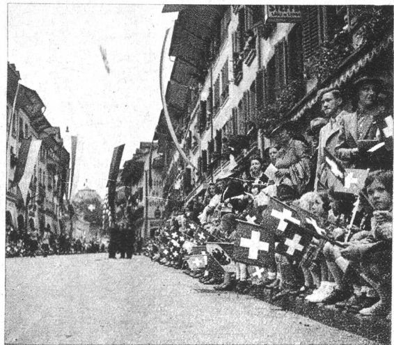
Die langen Gassen mit bunten Fahnen besetzten zu- erst die Kleinsten, denen es versagt war, am Uni- zug teilzunehmen. Mit ihren kleinen Fähnchen la- fen sie doch mit, das bunte Leben noch fröhlicher zu gestalten.