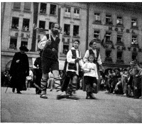
Die Gruppe Wilhelm Tell im Umzug.