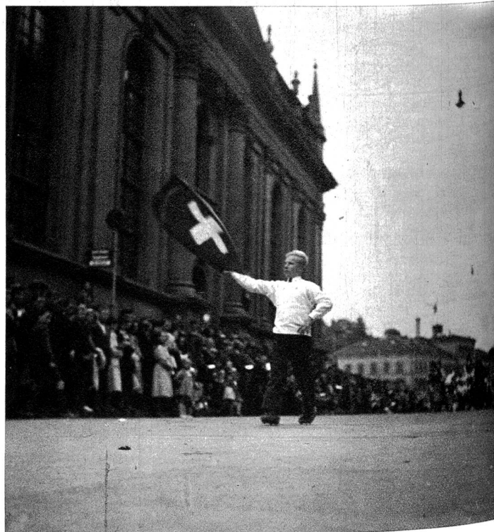
Der Fahenschwinger ging voran ...