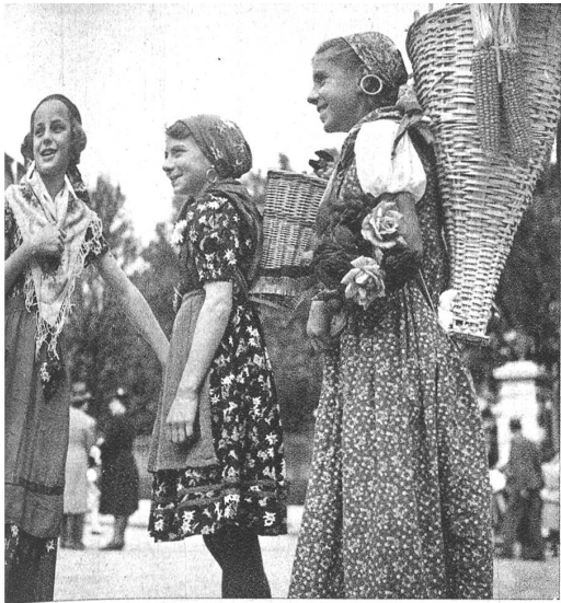
...siner Mädchen mit ihrem freundlichen Wesen warben ...ch Anmut für die herrliche Sonne unseres Südens.