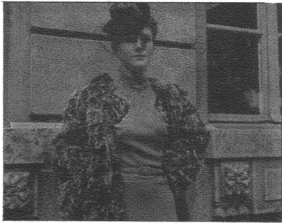
Grau gefärbte Kidkopfjacke, mit interessanten Aermeln und in loser Form gehalten, kommt in der neuen Saison zur Geltung. Dazu ein passender Hut in Seidensamt mit graufronziertem Kopf und schwarzem Rand. Kleine Velourmäschi in Rot bilden eine aparte Garnitur.

Modelle: Ciolina & Cie. A.-G., Bern. Hüte: Frau Gloor, Bern. Pelze: E. Englers Wwe., Bern.