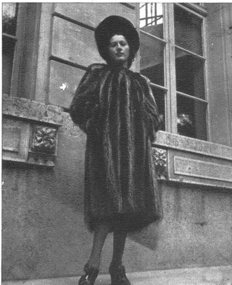
Washbär-Pelzmäntel sind dieses Jahr hoch in Mode und werden besonders bevorzugt. Ein Haarfilzhut dazu betont die jugendliche Note.