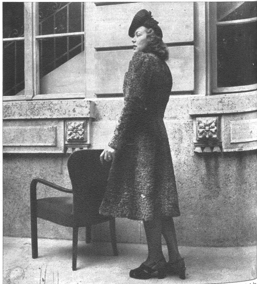
Der naturgraue Persianer wird durch alle modischen Wandlungen immer wieder und jedes Jahr neu in die Mode eingehen. Sein Effekt ist einzig — ruhig und elegant. Zu dem passt am besten ein schicker Jerseyhut mit Jerseydrapage, wobei diese um den Kopf geschwungen, die Ohren deckt. Filztrauben und -Blätter garnieren den Hut ausnehmend gut.