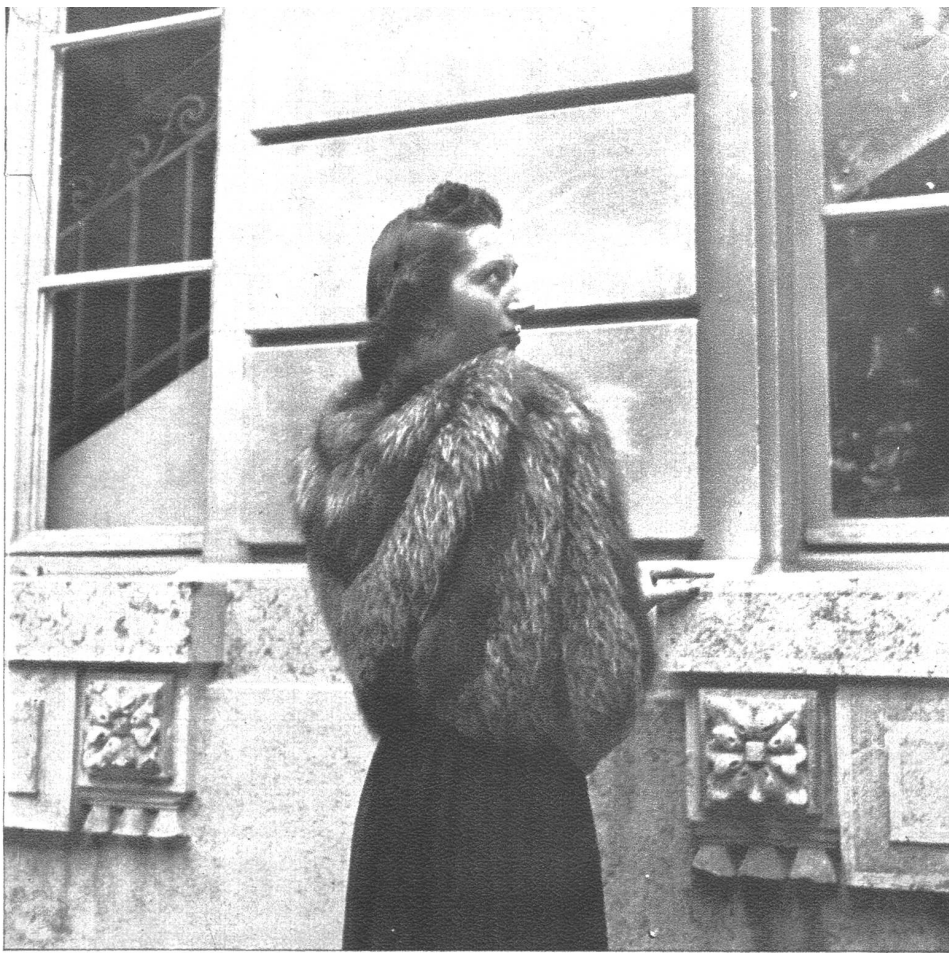
Ein Silberfuchscape zum Abendkleid betont nicht nur die elegante Linie, sondern bildet in der kalten Saison ein notwendiges Kleidungsstück.