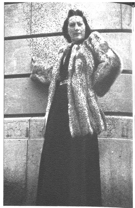
Eine Rotfuchs-Jacke ist immer gesucht. Ihre elegante Wirkung und praktische Verwendung geben ihr den Wert, den ihr nicht nur eine elegante, sondern auch praktisch veranlagte Frau beimisst.