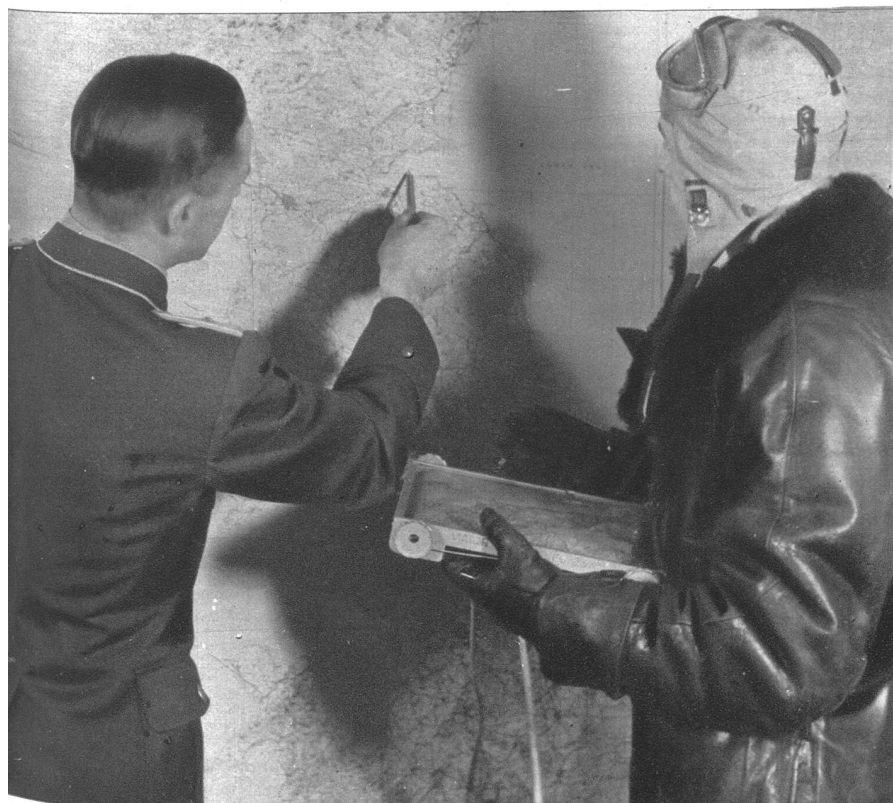
Neben der U-Bootwaffe ist der Flieger eine grosse Gefahr für die gegnerische Schifffahrt, die manchen Verlust auf Konto der Flugwaffe zu buchen hatte.