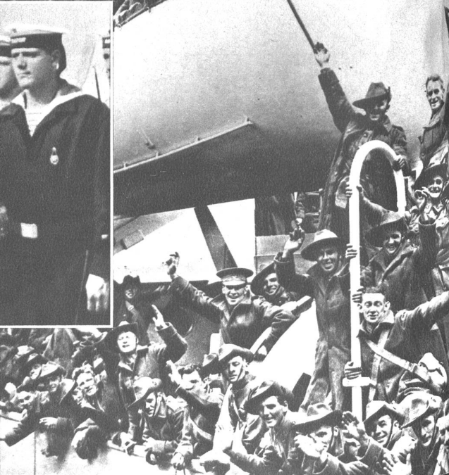
Rechts: Mit der Bedrohung der kaukasischen Front treffen australische Einheiten auf dem Seeweg im Persischen Golf ein, um unter das Kommando des englischen Generals Wavell gestellt zu werden