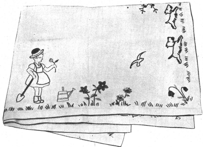
Kindertischdecke, weiss Halbfeinen, Platt- und Strilstich mit matter Baumwolle in bunten fröhlichen Farben