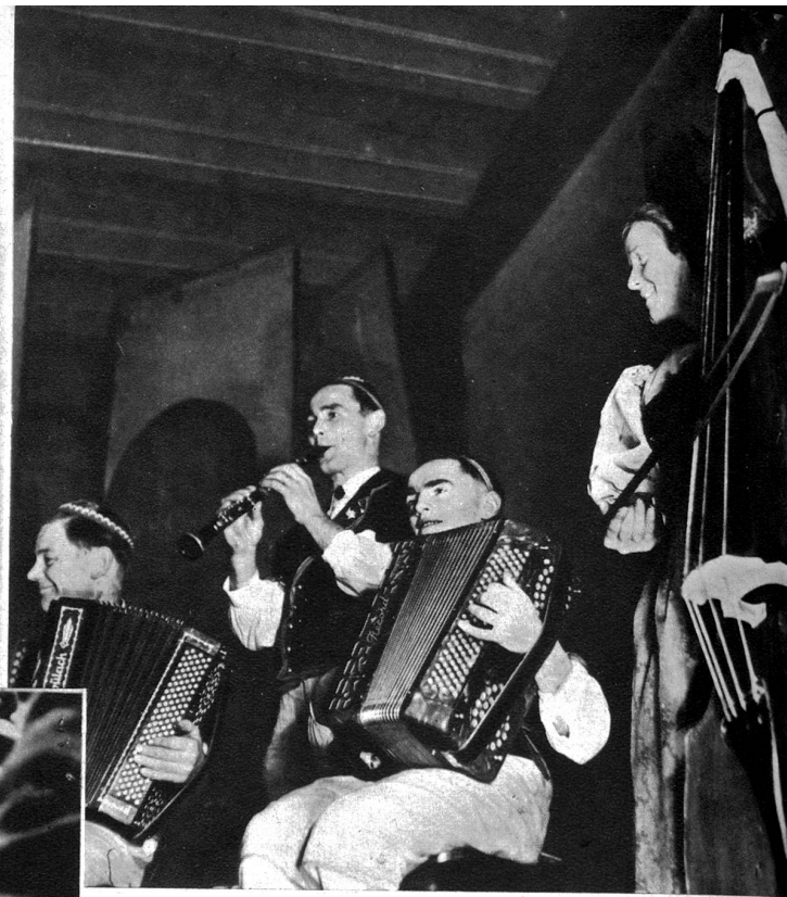
Die Edelwysybuebe spielen auf

Die „Edelwysybuebe“ haben eben in Zäziwil im Rössli in schmissigen Takten einen herrlichen Walzer ausklingen lassen und treten ab. Szenenwechsel: zwei zerlumpte Gesellen, in buntfarbige Kleider gehüllt, treten in das hellrote Licht der kleinen Bühne. Etwas Schminke, in Eile aufgetragen, eine künstliche Nase mit Schnurrbart und die weiten Hosen eines Clowns haben den lustigen Musikanten von vorhin dieses ganz andere Gesicht gegeben. Die Kinder ahnen es nicht. Für sie sind es heitere Spassmacher von irgendwoher, noch nie gesehen, nie begegnet. Für unsere kleinen Gäste beginnt nun ein fröhliches Spiel, an welches sie später noch manchmal gerne zurückdenken werden. Wohl kaum haben diese Bauernkinder schon einmal so ge-