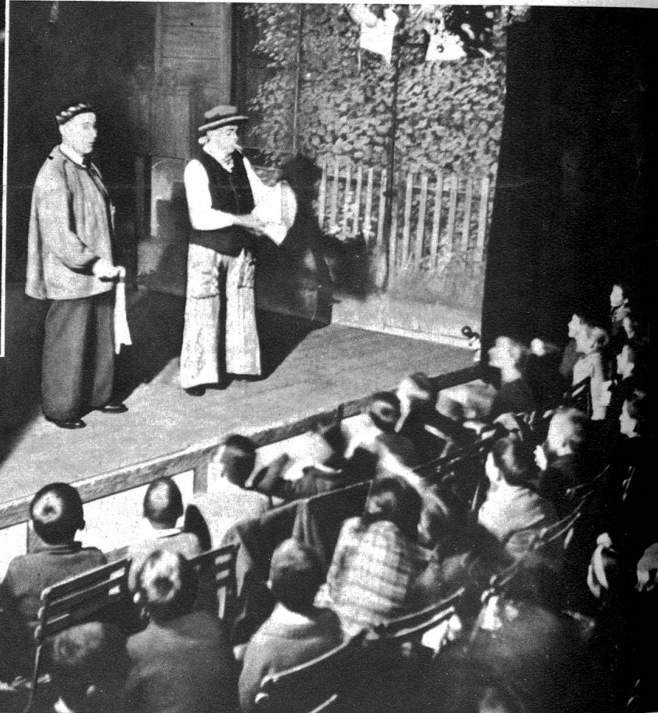
Die Komiker der Kapelle erregen Heiterkeit und Beifall