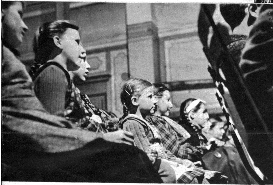
Kinder sind dankbare Zuschauer