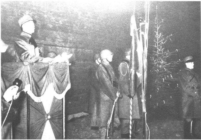
Armee-Weihnachten 1941. Auch dieses Jahr hat General Henri Guisan den Christabend bei der Truppe verbracht. Nachdem er in früheren Jahren am heiligen Abend bei einer Grenzlinie, in einer Militärkrankenanstalt und bei den Territorialtruppen weilte, galt sein diesjähriger Weihnachtsbesuch einer Einheit junger Soldaten irgendwo in der Schweiz. Im Freien brannte ein von Soldaten schlicht geschmückter Christbaum. Daneben, der Truppe zugewendet, stand eine Bataillonsfahne mit der Ehenwache. Der General richtete besinnliche Worte an die jungen, im Aktivdienst stehenden Soldaten. Auf dem Rednerpodium der General (VI Br. 9222 Photopress)