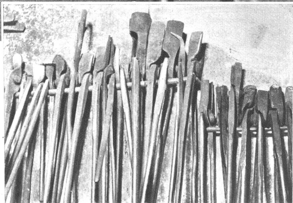
Links unten: Eine reiche Auswahl von Schmiede- zangen