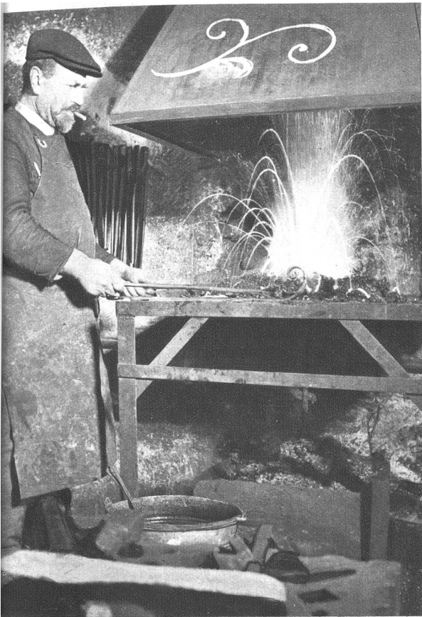
Stierlin an der Esse