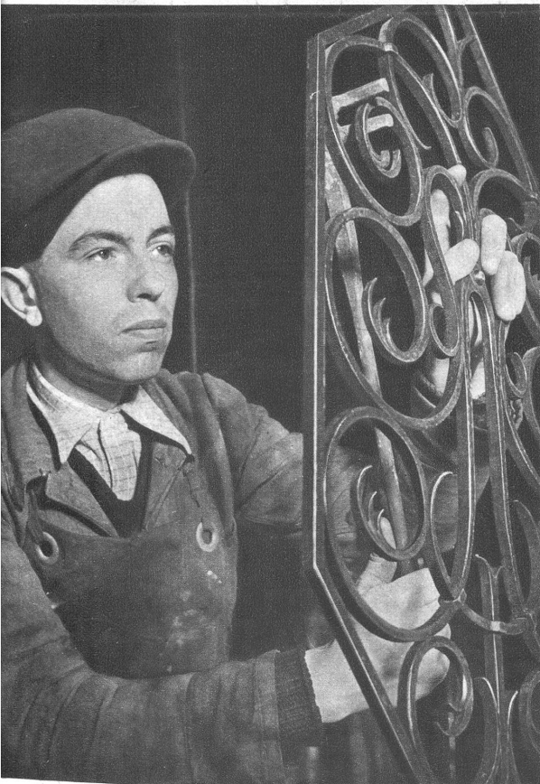
1 übt sich, was ein Meister werden will