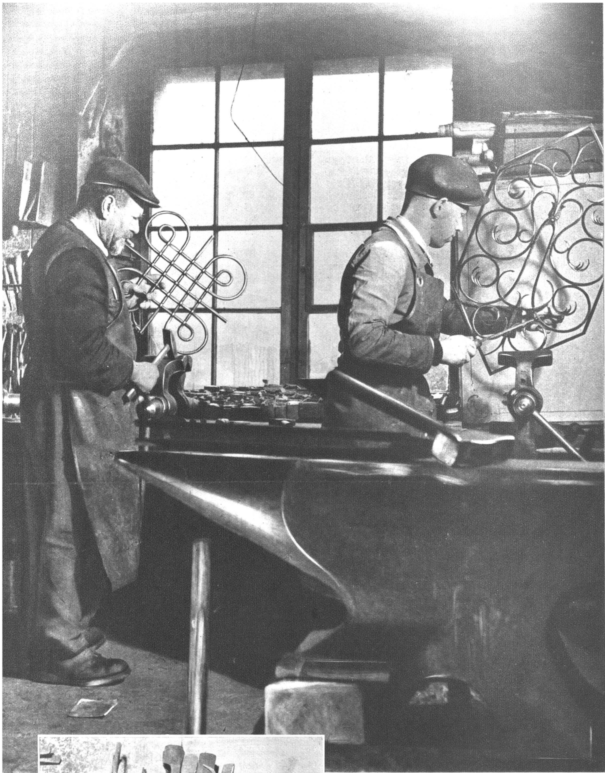
Links: Vater und Sohn an der Arbeitsbank