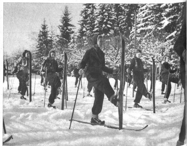
Skiturnen: Die Spitzkehre wird zerlegt