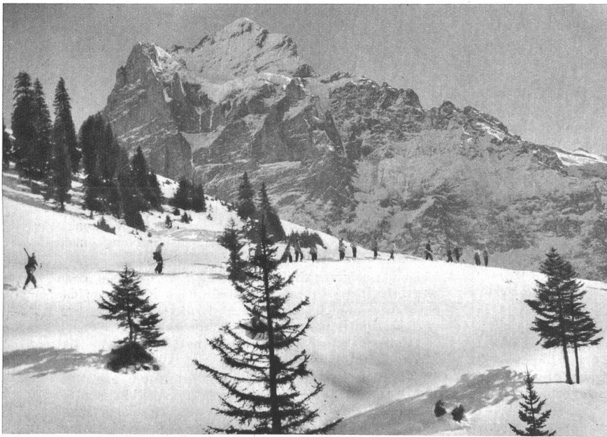
Hier gibt's keine Pisten