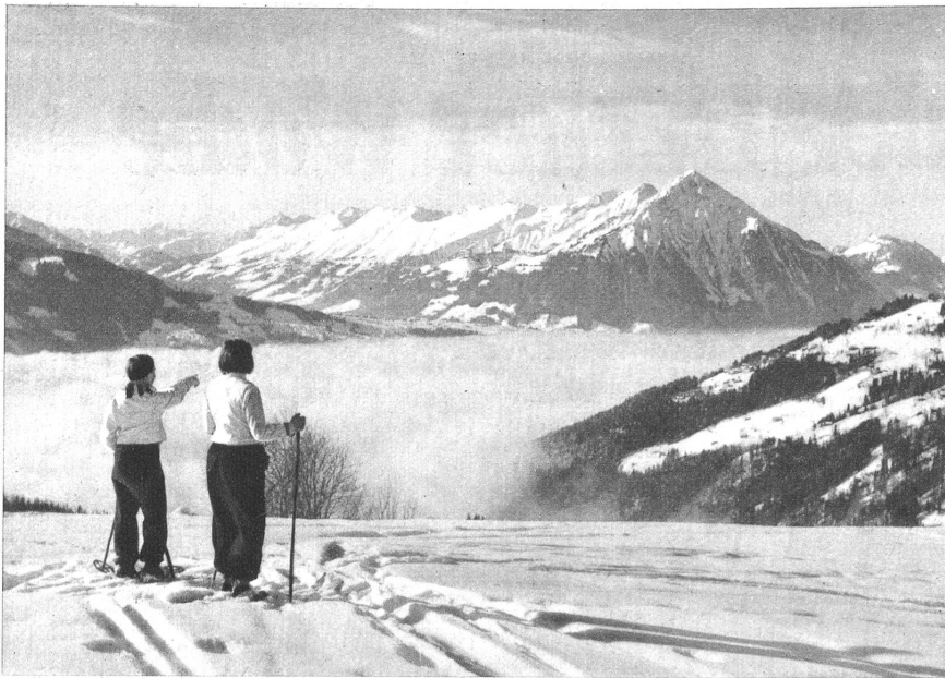
Sonnenaufgang über den Bergen