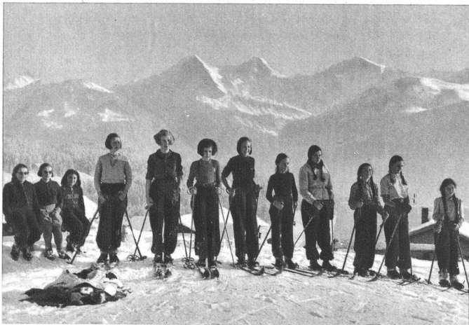
Bereit zum Start

Es ist seit Jahren in den städtischen Schulen aller Stufen üblich — auch wenn darüber die Tagespresse wenig oder nichts berichtet —, im letzten Schulquartal mit Schülerinnen und Schülern Skilager durchzuführen. Meist fanden diese Aufenthalte in Schnee und Sonne während der sogenannten Examentagen statt, also in der Zeit, da die unteren und oberen Schulen der stattfindenden Aufnahmeprüfungen wegen ihren Schülern kurze Ferien gönnen. Der Winter 1941/42 brachte insofern eine Neuerung, als die Neujahrsferien auf vier Wochen ausgedehnt werden mussten. Die städtische Schuldirektion erließ daraufhin die Weisung, dass allfällige Skilager während der Winterferien durchzuführen seien. Dabei bewilligte sie den einzelnen Schulen ansehnliche Beiträge, damit