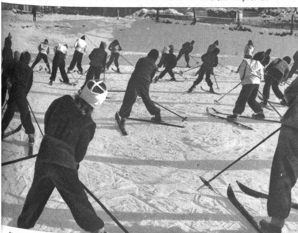
Skiturnen: Wie der Stemmbogen entsteht