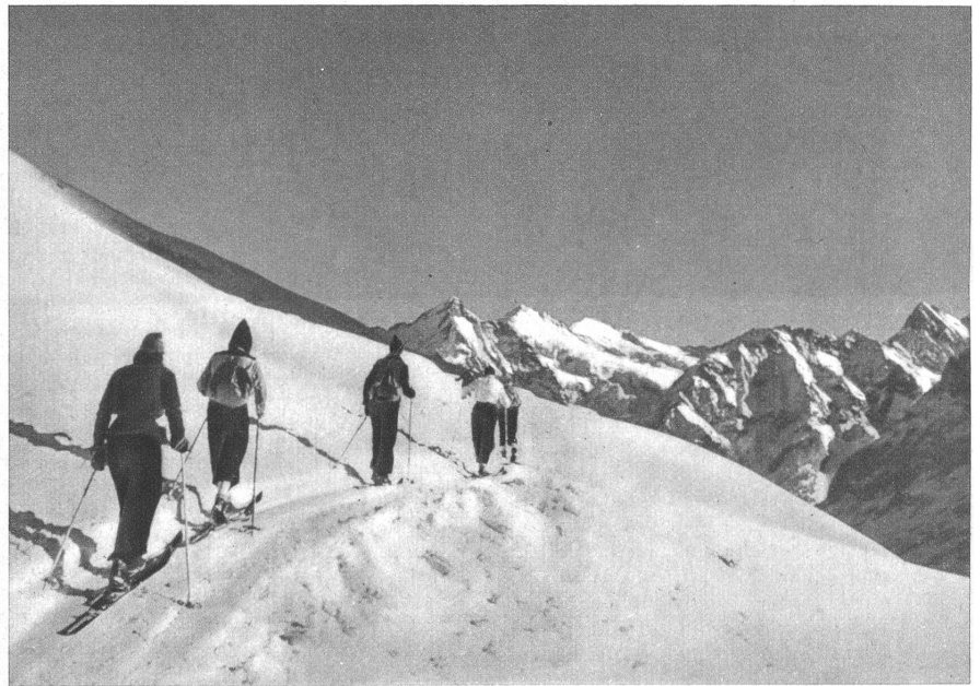
Dem Gipfel zu

es auch Kindern aus wenig begüterten Familien ermöglicht werde, an den Skilagern teilnehmen zu können. So sind denn in der Zeit vom 5. bis zum 18. Januar Hunderte von kleinen und grossen Kindern — denn auch die höhern Mittelschulen organisierten Lager und Skikurse — in unsere Berge gereist. Skihütten und Ferienhäuser bevölkerten sich, und besonders in der letzten Ferienwoche bescherte der Himmel den jungen Sportbegeisterten das strahlendste Winterwetter, das man sich wünschen kann. Wohl ging es nicht ab, ohne dass einige Skispitzen heimtückisch im Schnee stecken blieben, und auch der eine oder andere Unfall bewies, dass die Leiterinnen und Leiter der Skilager eine schwere Verantwortung zu tragen hatten. Das aber wird kein Hindernis sein, auch fernerhin unsere Jugend zum Skilauf zu ermuntern und mit ihr in unsere Berge zu ziehen — hinauf in Schnee und Sonne. -e-