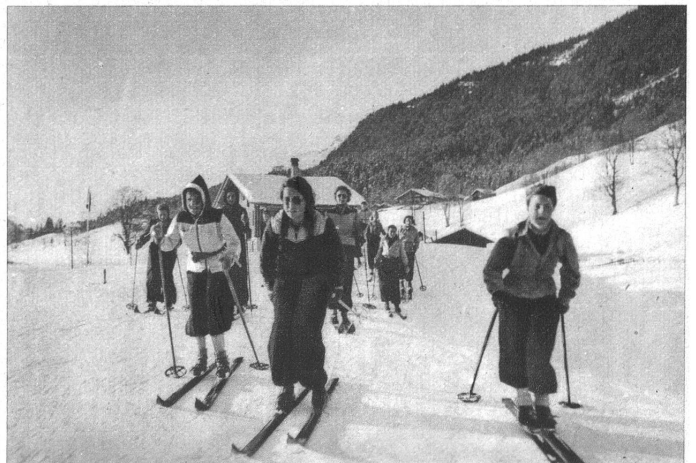
Abfahrt vom Uebungsfeld