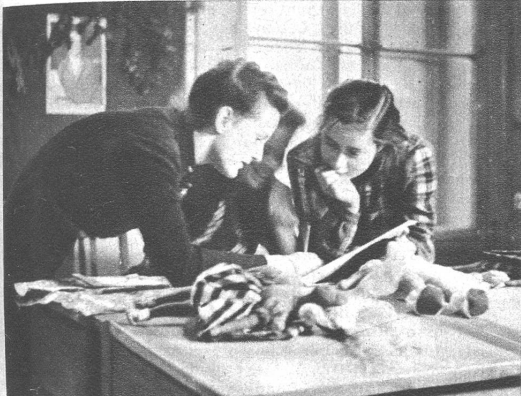
Was heute im Werkunterricht entsteht, soll wirklich selber erarbeitet sein. Eine Puppe aus Stoffresten, einem alten Strumpf, ein wenig Wolle, Garn und Watte; die Proportionen machen Kopfzerbrechen. Gemeinsam wird ausprobiert