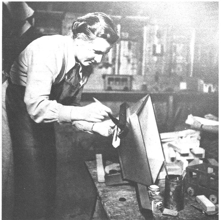
Der letzte Anstrich. — Sieht man unserer „Klassenmutter“ das Glück nicht an?