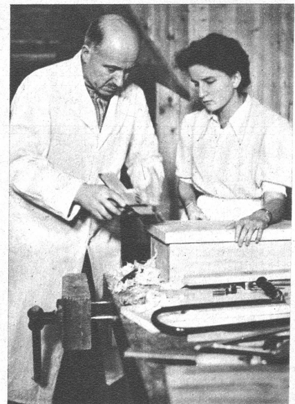
Herr Doktor prüft, ob der Deckel ganz genau passt

Links: Ein Blick in unsere Werkstatt! Ist das ein Leben, wenn ein Dutzend Töchter ihre Säge durchs Holz ziehen, hämmern und feilen und hobeln! Und welche Freude, welcher Stolz, wenn das hölzerne Auto, die Wiege oder Stall fertig als Eigenwerk dasteht!