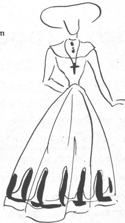
Ein raffiniertes Hütchen aus grobem Stroh mit netter Blumengarnitur