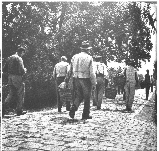
Nach dem Appell marschieren sie gemeinsam zur Arbeit

Auch einer von der Walz. Er hat die Spenglerei gelernt, mit 20 Jahren ging er auf die Walz nach Österreich, München, Mühlhausen, Pottheim, überall hat er gearbeitet. In Hamburg hat er es 2 Jahre ausgehalten, dann zog er auf einem Walfischdampfer über die Nordsee nach Spanien. Hätte er nicht die Rekrutenschule machen müssen, wäre er wohl nie mehr in die Schweiz gekommen