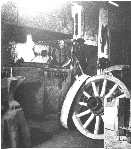
Links: Unter den Insassen finden wir meistens gelernte Handwerker, da gibt es Arbeit für den Schmied, den Spengler, Tapezierer und was gerade benötigt wird. – Unten: Nach dem Mittagessen macht sich's jeder nach seiner Art bequem, die kurze Ruhestunde will voll genossen werden