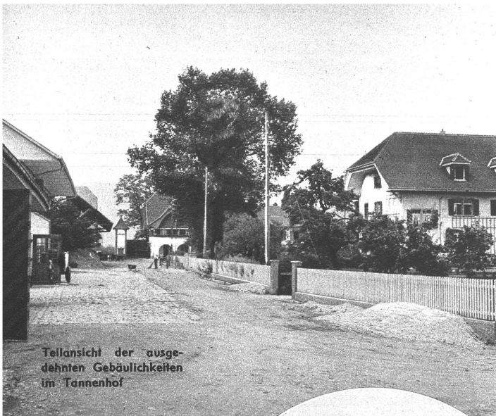
Tellansicht der ausgedehnten Gebäulichkeiten im Tannenhof