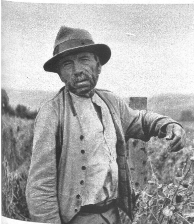
Das ist der älteste Pensionär mit seinen 82 Jahren. Stolz meint er, er habe mit 25 Jahren in Frankreich an den Fronten gearbeitet. Es sei eine schöne Zeit gewesen, alle Tage Zahntag, und der gute, billige Wein! Rechts: Mit der Glocke wird zum Essen gerufen, nun warten sie hier alle vor der Türe auf ihr täglich Brot

werden, das Vieh will gepflegt sein, daneben gibt es Arbeit für den Schreiner, den Schmied, den Sattler, — so gibt es für die Insassen immer alle Hände voll zu tun. Denn hier heisst es arbeiten von morgen früh bis abends spät, dafür erhalten sie das Essen und erst noch ein kleines Taschengeld. Am Sonntag sind sie frei und können Spaziergänge machen. Der Tannenhof hat heute eine grosse soziale Bedeutung erlangt. Die Insassen haben es hier gut — wenn auch später manche von ihnen in ihr früheres Milieu zurückkehren, gibt es auch solche, die der Wanderschaft und dem Existenzkampf müde — im Tannenhof bleiben.