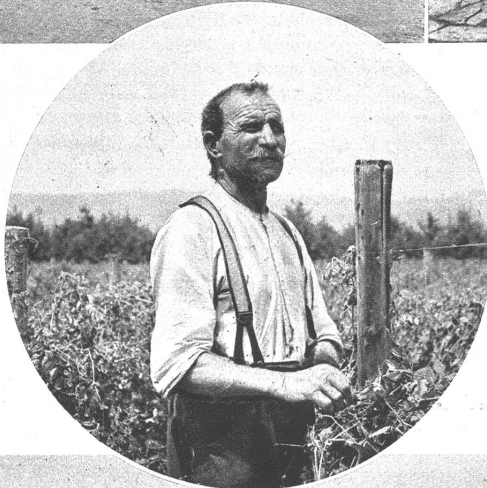
Unübersehbare Felder müssen bestellt werden. Wer den ganzen Tag Erbsen abgelesen hat, weiss den Feierabend zu schätzen

Auch einer von der Walz. Er hat die Spenglerei gelernt, mit 20 Jahren ging er auf die Walz nach Österreich, München, Mühlhausen, Pottheim, überall hat er gearbeitet. In Hamburg hat er es 2 Jahre ausgehalten, dann zog er auf einem Walfischdampfer über die Nordsee nach Spanien. Hätte er nicht die Rekrutenschule machen müssen, wäre er wohl nie mehr in die Schweiz gekommen