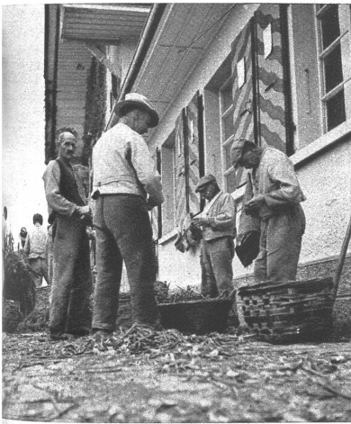
Bei den Zwiebeln rüsten. Überall sieht man solche Arbeitsgruppen

werden, das Vieh will gepflegt sein, daneben gibt es Arbeit für den Schreiner, den Schmied, den Sattler, — so gibt es für die Insassen immer alle Hände voll zu tun. Denn hier heisst es arbeiten von morgen früh bis abends spät, dafür erhalten sie das Essen und erst noch ein kleines Taschengeld. Am Sonntag sind sie frei und können Spaziergänge machen. Der Tannenhof hat heute eine grosse soziale Bedeutung erlangt. Die Insassen haben es hier gut — wenn auch später manche von ihnen in ihr früheres Milieu zurückkehren, gibt es auch solche, die der Wanderschaft und dem Existenzkampf müde — im Tannenhof bleiben.