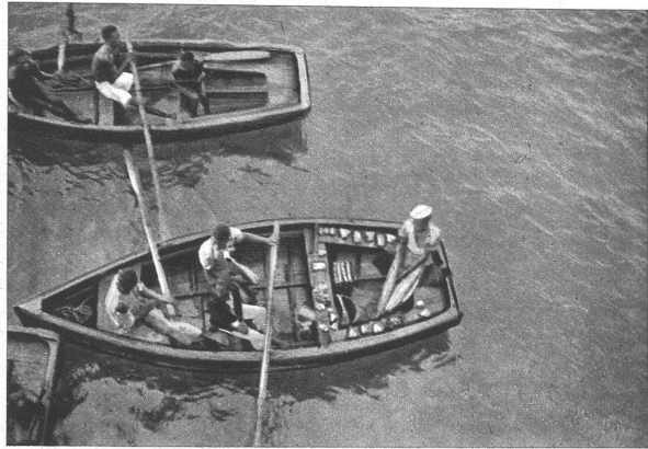
Handelnde und bettelnde Neger in der Bucht von S. Vicente

Eine grosse Zahl von Geschäftshäusern sind wegen Warenmangel geschlossen. Es ist wirklich ein armes Spanien. Um in das vom Bürgerkrieg sehr hart mitgenommene Universitätsviertel zu fahren, reicht unsere Zeit leider nicht, da wir um 23 Uhr gleichen Tags ja schon wieder weiter reisen. Um 20 Uhr erwartet uns der Beamte der Wagons-Lits Cook am Bahnhof zur Zollrevision. Diesem Mann drücke ich einen 20-Pesetenschein und eine Schachtel Schweizer-Zigaretten in die Hand, und die Geschichte geht wie von selbst. Einen einzigen Koffer muss ich öffnen und in 5 Minuten ist die ganze Angelegenheit vorbei. Hier treffen wir mit einigen Schweizern zusammen, in deren Gesellschaft wir bis Lissabon fahren. Man schläft und raucht abwechslungsweise ein wenig, und am Mittwoch-