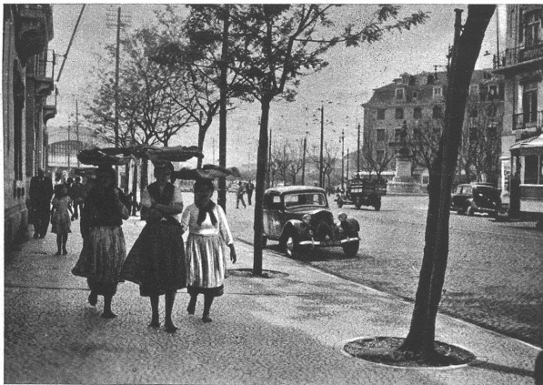
Strassenbild aus Lissabon

Endlich, nach etwa halbjährigen Bemühungen, sind wir so weit, abreisen zu können, die Schiffsplätze sind belegt und die verschiedenen Durchreisevisas beisammen. Es ist der 4. April 1941. Am Morgen früh werden im Reisebureau noch die letzten Instruktionen entgegengenommen, Geld eingewechselt und die Fahrkarten in Empfang genommen; dann geht's nach dem Bahnhof, wo sich bereits eine Anzahl Verwandte und Bekannte zum letzten Lebewohl eingefunden haben. Punkt 9 Uhr 32 fährt der Zug nach Genf, wo wir um 11 Uhr 48 ankommen. Hier werden im Bureau der Fima I. Véron, Grauer & Co. Gepäckschein und die Schlüssel des grossen Gepäcks in Empfang genommen, welches bereits am Tag zuvor von hier nach der spanischen Grenze speditiert wurde. Die Gepäckabfertigung am Schweizerzoll geht ziemlich rasch, und um 15 Uhr 30 verlassen wir Genf, Richtung Annemasse. Dafür dauert die Geschichte in Annemasse ziemlich lange. Der verschärften französischen Devisenvorschriften wegen muss ich mich sogar einer Leibesvisitation unterziehen. Es beginnt zu regnen und etwa um 18 Uhr geht es weiter. Wir fahren 2. Klasse, aber die Wagen sind alle stark überfüllt. In Chambéry gibt es von 21—22 Uhr einen Aufenthalt und ein Nachtessen im Bahnhofbuffet. Menu: Suppe, Rührei mit Spinat und Toast, dazu je eine Flasche Wein und Mineralwasser. Preis: 55 französische Franken. In Valence müssen wir umsteigen, aber die 2. Klasse ist derart überfüllt, dass wir bis Avignon stehen müssen. Am Samstag-