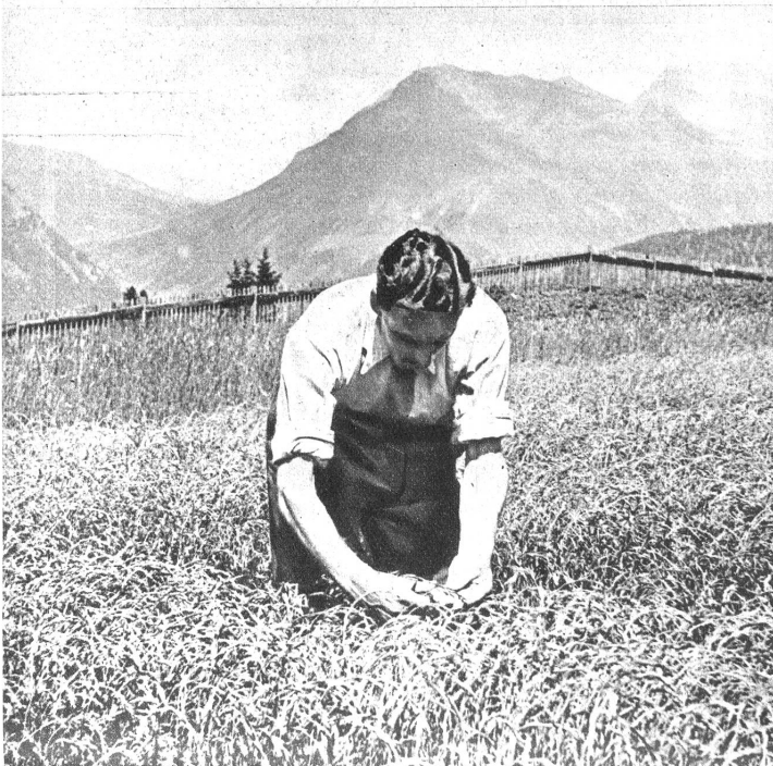
Unten: Mehranbau — 1900 Meter über Meer Flachsbaum ob Arosa. Der eidgenössischen landwirtschaftlichen Versuchsanstalt ist es gelungen, auch das Alpenland der Volkswirtschaft nutzbar zu machen: In Maran, oben an Arosa, auf dem alpinen Versuchsfeld, gedeiht, wie unser Bild beweist, der Flachsbaum nach Wunsch. Auf der Versuchspartzele wurden drei Sorten „Holländer“ und „Rigaer“ anfangs Juni gepflanzt, und jetzt, Ende August, steht der Flachs schon über 60 Zentimeter hoch!