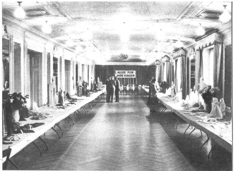
In der Abteilung „Alles für Ihre Kinder“ war die Auswahl der Modelle besonders reichhaltig