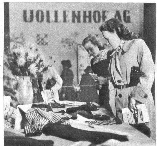
Die Besucherinnen bewunderten eingehend die ausgestellten Modelle. Zirka 8000 Personen haben die Ausstellung besucht

Trotz Rationierung und Rohmaterialverknappung ist Wolle in allen neuzeitlichen Farben und in allen neuen Modellen bei der Ausstellung im Casinc zur vollen Geltung gebracht worden. Angefangen von den kleinsten Dingen für Kinder bis zum raffiniertesten Pullover für Damen und Herren, überall zeigten sich die gute Auswahl, Geschmack und schöne Ausführung der Modelle. Es war für die Besucher eine Augenweide, die Fülle der ausgestellten Kollektionen bewundern zu können, bei welcher Gelegenheit die belehrende Aufklärung, der Sinn der Ausstellung deutlich zum Ausdruck kam.