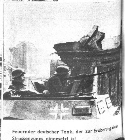
Feuernder deutscher Tank, der zur Eroberung eines Strassenzuges eingesetzt ist