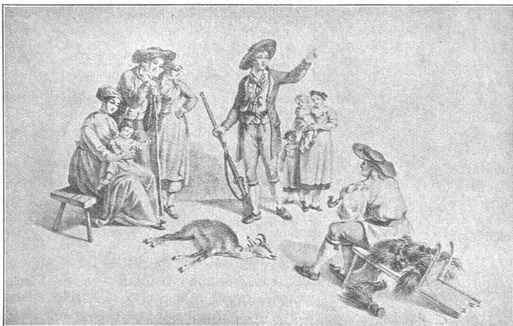
Heimkehr von der Gamsjagd

Jeanne betrachtete ihren Mann, der sich etwas abgewandt hatte, aufmerksam, dann sagte sie, den Kopf schüttelnd, mit starker Betonung: „Nein, das hat der Franz nicht getan! Glaub mir — das hat er nicht getan — das nicht!“