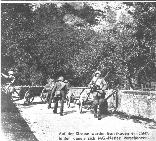
Auf der Strasse werden Barrikaden errichtet, hinter denen sich MG.-Nester verschanzen.

Die Rekrutenschule bildet für die jungen Männer ein Erlebnis, an das sich die meisten zeitlebens gerne erinnern, aber sie ist auch ein Teil seiner Lebensschule, und wer ein guter Soldat geworden ist, der wird auch ein guter Bürger bleiben. Wenn es auch viel Anstrengung, Aerger und Unbequemlichkeiten gibt während dieser Zeit, so sind doch wiederum Momente vorhanden, die in ihrer Grösse alle Schattenseiten vergessen lassen. Zu den wichtigsten Ereignissen der Rekrutenschule gehören sicher die Manöver, die als Höhepunkt der Ausbildung die praktische Anwendung des Gelernten zur Ausführung bringen. Die Aufgabe lautet: Die Kompanie hat einen Handstreich auf ein Dorf zu unternehmen. Sie wird von leichten Mot.-Truppen unterstützt.