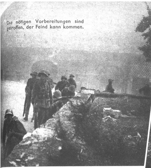
Die nötigen Vorbereitungen sind getroffen, der Feind kann kommen.