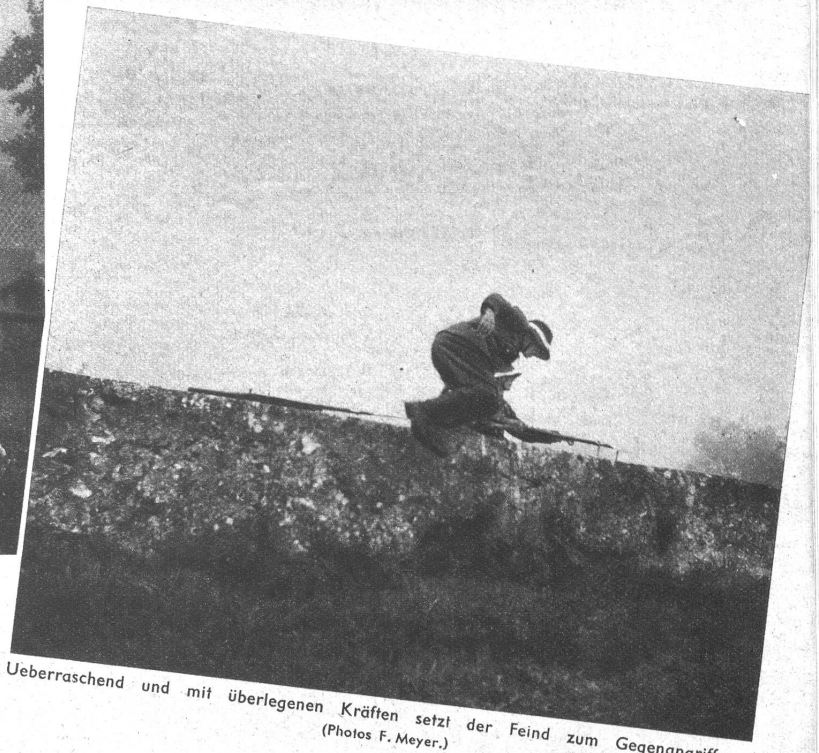
Ueberraschend und mit überlegenen Kräften setzt der Feind zum Gegenangriff an.