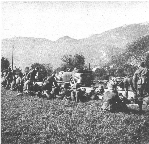
Weit auseinander gestaffelt rückt die Infanterie nach.