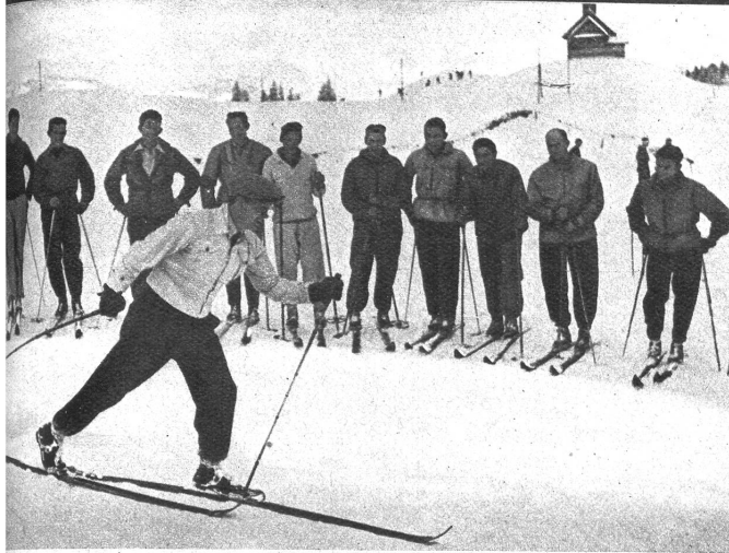
...redens beste Skifahrer instruieren die Schweizer Skilehrer. Auf dem Stoons ...reinigten sich die schweizerischen Regionalverbandstrainer, um sich von den ...schwellen Schweden in alle Geheimnisse ihrer Technik einführen zu lassen. ...er Bild zeigt Nils Englund, Weltmeister über 18 und 50 km., bei Langlauf-Instruktion