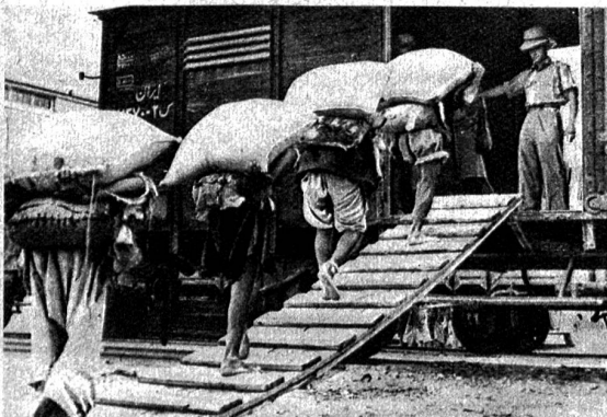
Trotzdem die russische Kriegsproduktion gewaltig angewachsen ist, fließen doch Mengen aus der angelsächsischen Produktion über Persien und die transtranische Bahn nach Russland