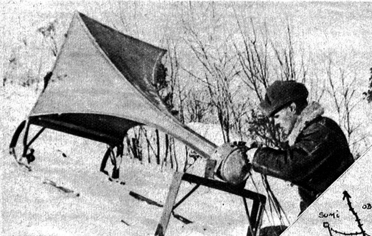
Auf Schlitten montierter Riesensprecher, der von den Russen während den kurzen Kampfpausen zur Propaganda an den deutschen Soldaten verwendet wird