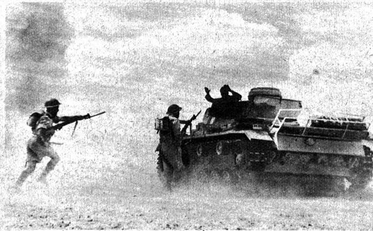
Wüstengefechte in Tripolitaniien. Britische „Vorausabteilungen“, die gerade einen gefechtsunfähig geschossenen deutschen Panzerwagen mit blanker Waffe stürmen ATP