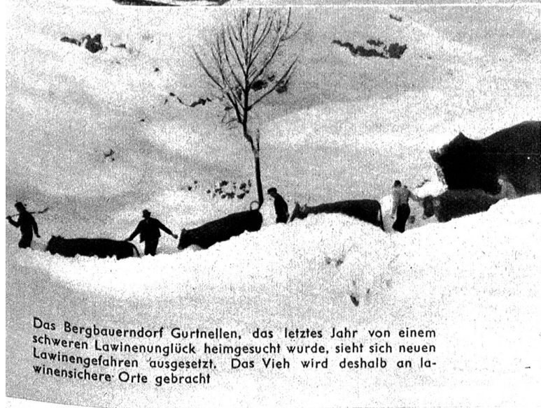
Das Bergbauerndorf Gurtellen, das letztes Jahr von einem schweren Lawinenglück heimgesucht wurde, sieht sich neuen Lawinengefahren ausgesetzt. Das Vieh wird deshalb an lawinensichere Orte gebracht