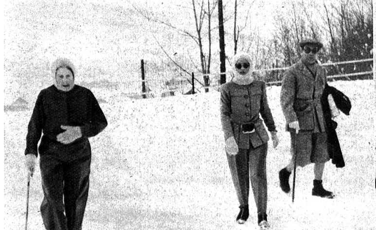
Die Ex-Königin von Spanien ist mit Gefolge zu einem Wintersportaufenthalt in Gstaad eingetroffen. Die Exkönigin mit der Prinzessin Cramayel und dem Grafen Apponyi