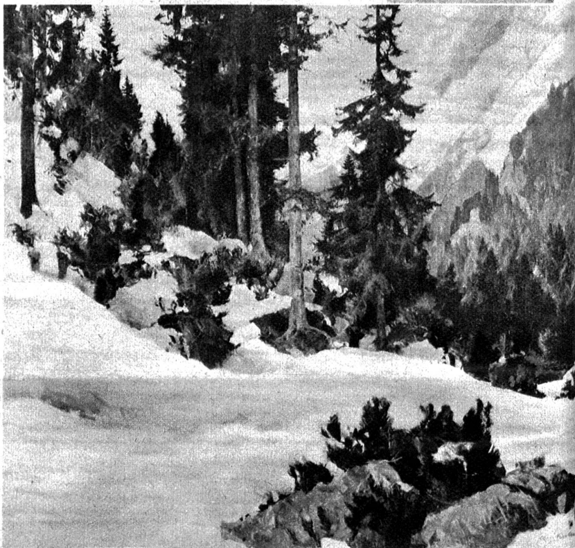
„Am Susten, Schneeschmelze“ von Leo Kalmus, Bern