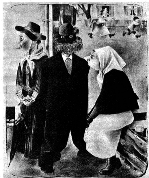
„Buebefasnacht“ von Bernhard Merz, Zürich