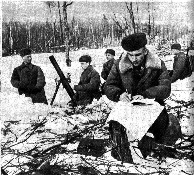
Sowjetrussische Minenwerferbatterie im Raume von Millerowo, welche die deutschen Stellungen unter Beschuss nimmt