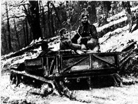
Das Kettenfahrzeug, eine Verbindung von Schneekette und Raupenschlepper, ist an vielen Stellen der Ostfront das einzige Vehikel, mit dem der Nachschub bewerkstelligt werden kann