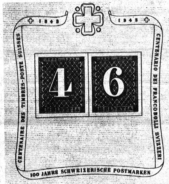
Diesen Herbst feiert die Briefmarke ihr 100jähriges Bestehen. Zu diesem Anlass gibt die Eidg. Postverwaltung vom Februar an einen Zweierblock heraus, die alten „Züri-Vieri“ und „Züri-Sächsi“ darstellend. Der Ertrag kommt der Schweiz. Nationalspende zu gut

Links: Die Berner Meitschi im Jugendlager in Arosa