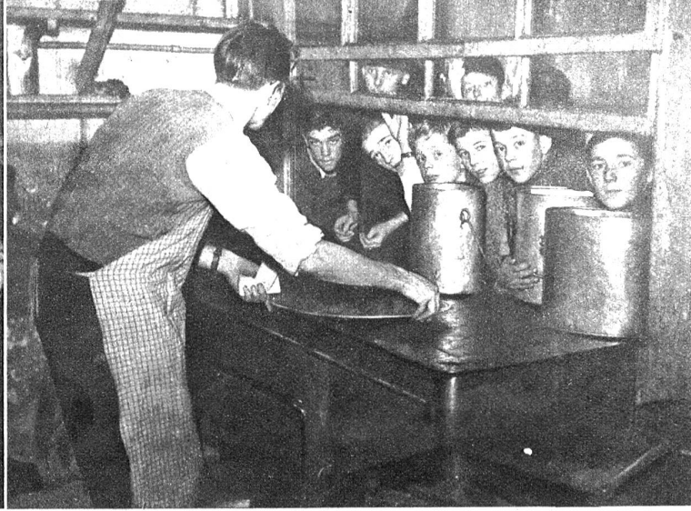
Unsere Berner Buben beim Singen am Abend. — Oben rechts: Das Fassen des Essens war eine wichtige Angelegenheit und alle drängten sich zur Küche